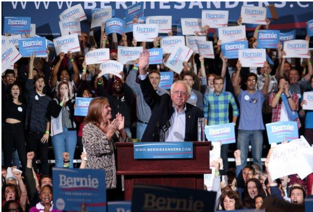
Massrörelsen kring Sanders har skakat om USA:s etablissemang.

Presidentvalkampanjen i USA representerar en vändpunkt för USA:s samhälle och för arbetarklassens, medelklassens, de ungas och av kapitalismen exploaterades kamp. Samhället i USA är i greppet på en masspolitisering och förkastande av, eller massopposition till, de etablerade politiska partierna och deras ledningar. 26 procent av väljarkåren är registrerade som republikaner och 30 procent som demokrater. Den största gruppen är emellertid registrerade som "oberoende", 43 procent, vilket endast indikerar en del av det potentiella stödet för ett nytt parti. Tvåpartisystemet i USA håller på att falla sönder.