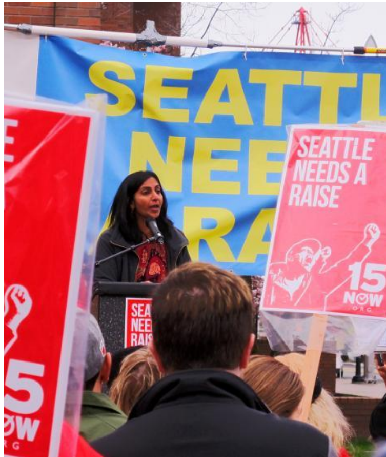
Socialist Alternative och Kshama Sawant kämpar för bygget av ett nytt massarbetarparti för de 99 procenten.

Det är en brådskande uppgift för Bernie att sammankalla en nationell församling av Sandersanhängare och de som vill kämpa för att försvara alla arbetares intressen, mot rasism och för bygget av ett nytt politiskt alternativ till de kapitalistiska Republikanerna och Demokraterna samt den härskande klass de representerar. Detta kan lägga grunden för att kanalisera den rörelse som hans kampanj har släppt lös och debattera nästa steg för att ta kampen framåt.