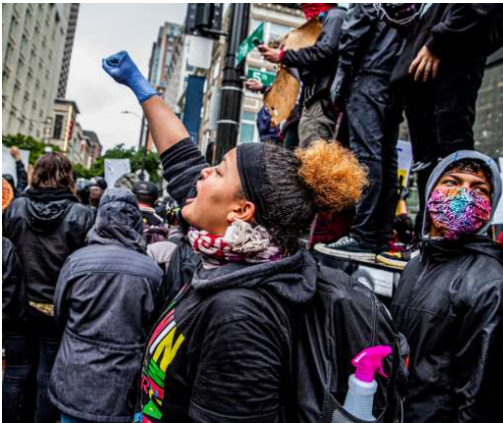
Polisens terror och kapitalismens plågor har mött en urstark massrörelse i Seattle (Foto: Kelly Kline / Flickr CC).

Lördagen den 30 maj bröt massprotester ut i Seattle med krav på Rättvisa för George Floyd, vilket omedelbart möttes av polisvåld. På bilder och videos kan man se hur små barn och passagerare i fordon pepparsprayades, material som till och med stack ut i sin brutalitet jämfört med tusentals liknande bilder från resten av landet.