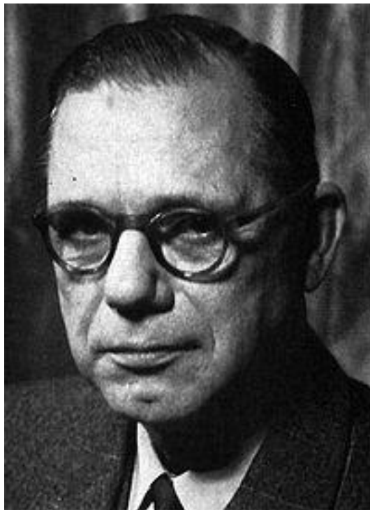
Sven Linderot. SKP-ordförande 1929-1951