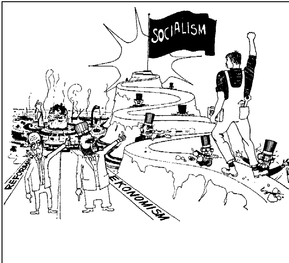
KFMLr:s väg till socialismen (ur Klasskampen 2/70)

Men resonemanget i Kampens väg är felaktigt även bortsett från detta. Ty, vad är det som kännetecknar reformismen även vad gäller den rent fackliga kampen? Jo, att den förs just med hänsynstagande till den kapitalistiska ekonomins bärkraft. En konsekvent reformist är tvingad att ta hänsyn till den kapitalistiska ekonomin i sin helhet, eftersom han inte är beredd att kämpa för krossandet av det kapitalistiska systemet. Det är också med hänvisningar till den svenska ekonomins bärkraft, som socialdemokratin brukar argumentera mot arbetare i kamp (t.ex. under gruvstrejken). Dessutom har vi aldrig påstått att kampen "genast" blir revolutionär om den förs utan hänsyn till "kapitalets profitintresse". Det vi har sagt, är att vi arbetar för en inriktning, som utvecklar arbetarklassens självständiga kamp och leder in den i banor, som betyder konfrontationer med det kapitalistiska systemet som sådant och fram emot en proletär revolution. Vad menar KFMLr med en revolutionär "arbetsplatspolitik"?