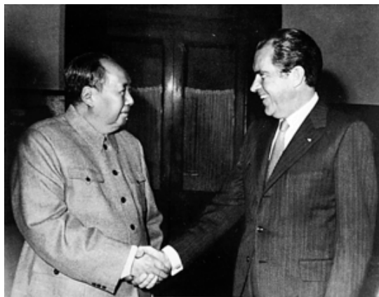
Mao träffar president Nixon i februari 1972

Man kunde ha sett att Nixons Kinaresa var Maos avslutande av tanken på världsrevolution och ett sätt att slå vakt om den kinesiska nationen gentemot Sovjet. Då hade också förståelsen varit större för att den kinesiska politiken därefter hade det som ledstjärna, t.ex. i handeln med Chile, synen på EEC eller stödet till vissa befrielseströrelser. Det var ungefär som ”socialism i ett land” eller hellre Molotov-Ribbentrop-pakten, nödvändig att försvara för de partier som tillhörde Komintern. Det handlade om att försvara socialismens enda stat.