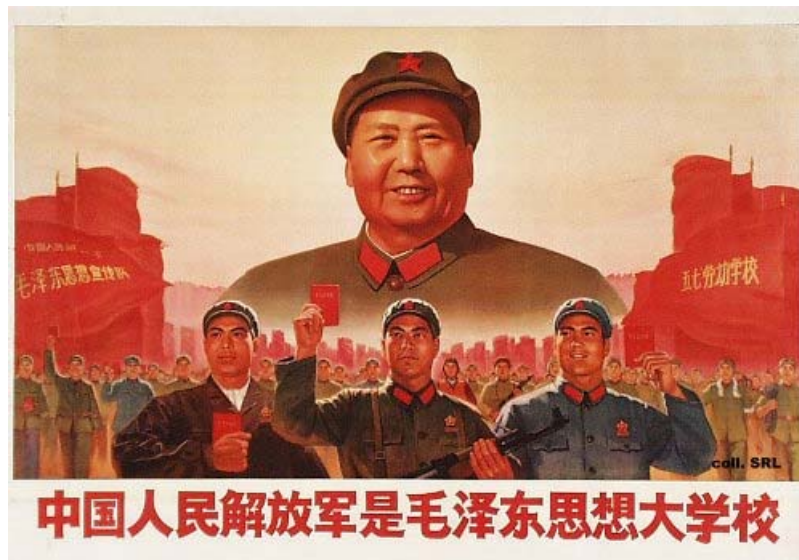
Affisch från kulturrevolutionen

För att belysa det som åsyftas med voluntarism och idealism ska vi här citera Mao från 1961-62 där han kommenterar en sovjetisk lärobok i ekonomi: