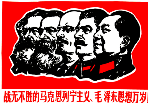
De fem stora

För det första måste man inse att maoismen har sina ideologiska, politiska och organisatoriska rötter i stalinismen. Från mitten av 1920-talet hade det stalinistiska Komintern stort inflytande över det kinesiska kommunistpartiet, vilket givetvis påverkade det på många plan. Man kan inte förstå och analysera maoismen utan att studera denna historia och dess konsekvenser. Kineserna försökte följande även efter det att konflikten med Sovjet hade brutit ut anknyta bakåt till stalinismen (vem minns inte bilderna på ”de fem stora”, kinesernas försvar för Stalin i polemiken mot Sovjet osv). 6 De använde också ”stalinistiska metoder” (historieförfälskning, personkult, censur, förföljelse av ”dissidenter” osv).