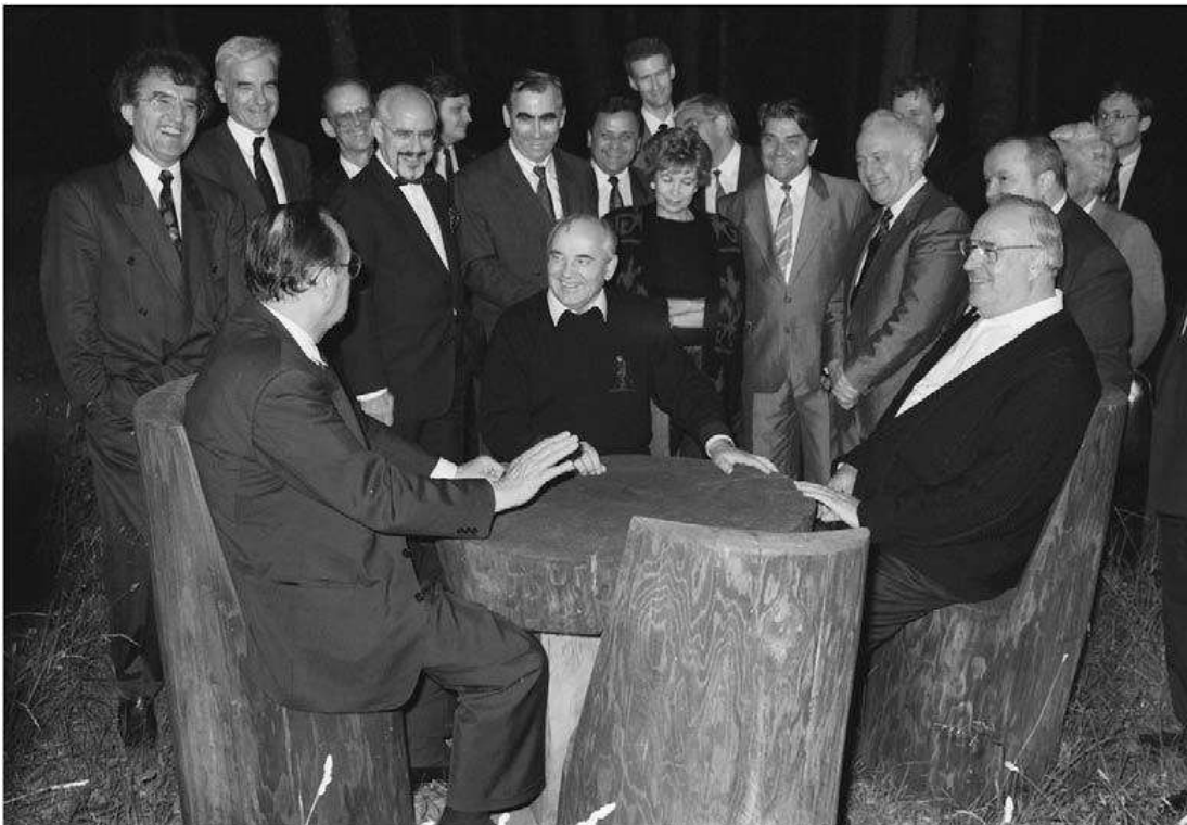
Ovan: Gorbatjov diskuterar Tysklands återförening med med Genscher och Kohl i Ryssland 15/7 1990.

Moskva, under vilka amerikanska och västtyska förhandlare framförde någon form av verbal försäkring mot någon typ av NATO-utvidgning. Forskare är till exempel överens om att Baker sade till Gorbatjov och den sovjetiske utrikesministern Eduard Sjevardnadze den 9 februari 1990 att ”det inte kommer att bli någon utvidgning av NATOs jurisdiktion eller Natos styrkor en tum österut”, om Gorbatjov samtyckte till tysk återförening. 39 Därefter instämde Baker också i Gorbatjovs påstående att ”en breddning av NATO-zonen inte är acceptabel”. 40 För att förstärka detta budskap erbjöd västtyske förbundskanslern Helmut Kohl och utrikesminister Hans-Dietrich Genscher sovjetiska ledare liknande villkor följande dag. Dessa samtal fick dessutom verkliga konsekvenser, eftersom Gorbatjov gick med på att förhandla om villkoren för tysk återförening efter diskussionerna med Baker och Kohl. 41