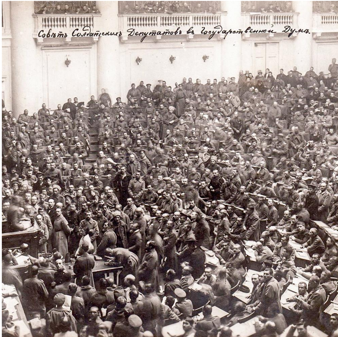
Petrogradsovjeten 1917. Dessa slags demokratiska organ för arbetarstyre ersattes efter Lenins död av en byråkratisk diktatur.

länder, men senare blev den i sin strävan att behålla makten en medveten faktor för att stoppa arbetarnas revolutioner och kamp, särskilt i Spanien 1936-39.