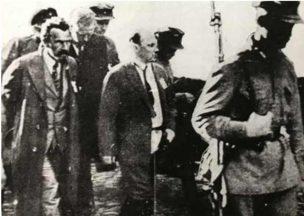
Ovan Rykov och Bucharin kort innan 1938 års Moskvaprocess