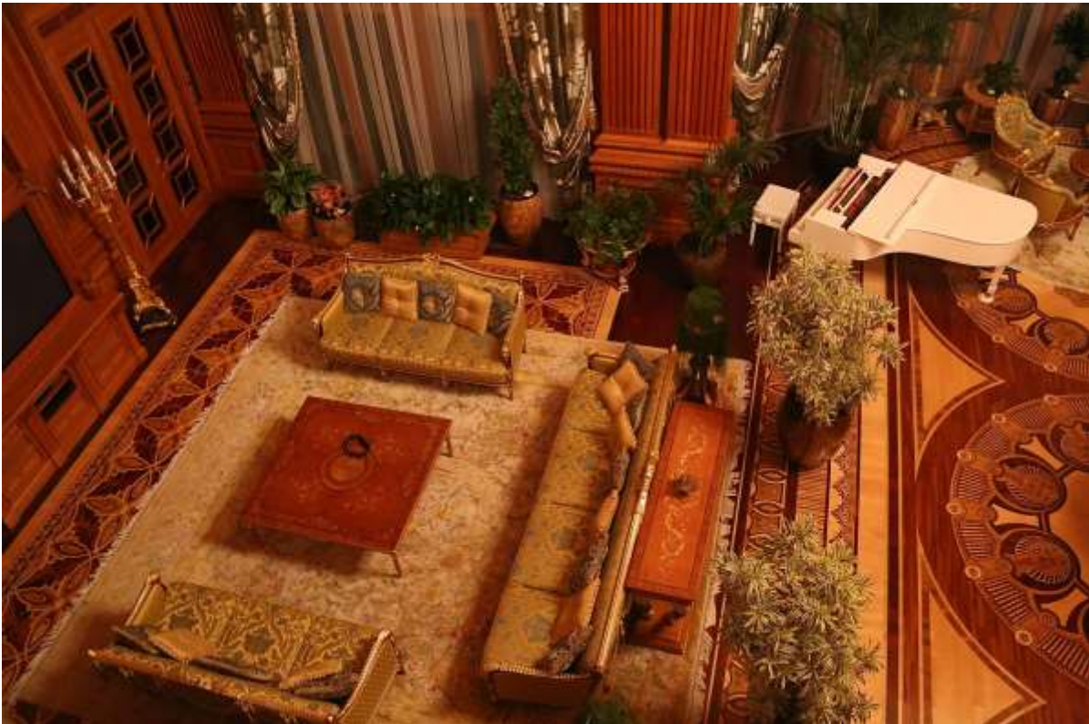
Interiör från Janukovitjs palats. Se lästipsen för fler foton.