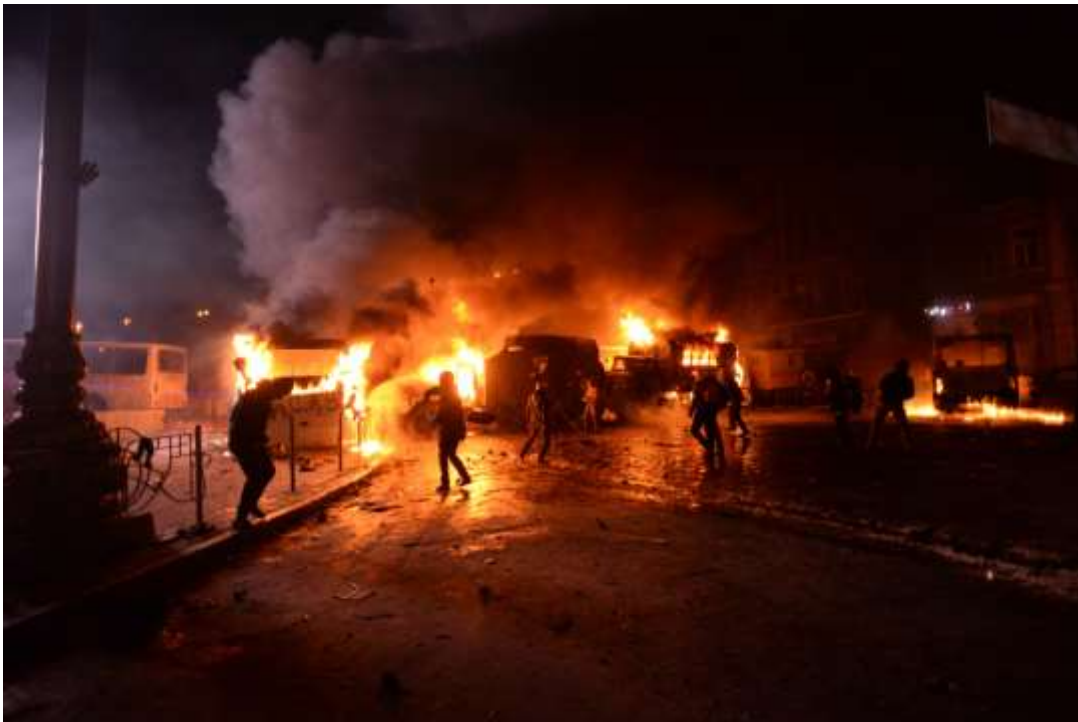
Demonstranter kastar Molotovcocktails mot inrikestrupper, Kyiv 19/1 2014. Foto: Mstyslav Chernov. Licens CC BY-SA 3.0

De första dödsoffren på Majdan skedde natten mellan den 21 och 22 januari 2014. Tre unga män miste livet uppe vid den sista barrikaden på Hrusjevskogatan. En av dem antingen föll ned eller blev nedknuffad från en hög mur. De andra två sköts till döds av krypskyttar. Troligen från taket på regeringsbyggnaden. En av dem med fyra skott i huvudet.