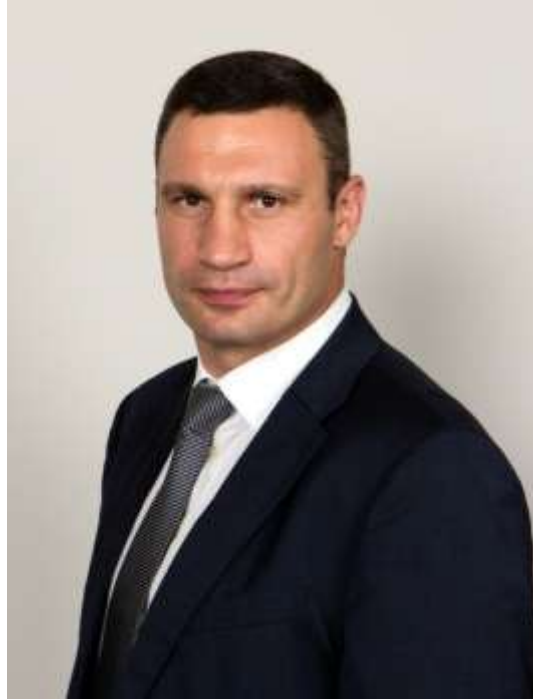
F d boxningsvärldsmästaren Klitsjko är fortfarande borgmästare i Kiev.

Det visade sig snart att dessa tre politiker, Arsenij Jatsenjuk, Oléh Tjahnybok och Vitalij Klitsjko, var mindre samspelade än trion från den orangea revolutionen år 2004.