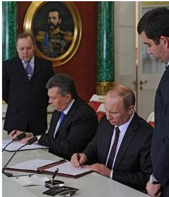
17 december 2013 undertecknade Vladimir Putin och Viktor Janukovyj ett bilateralt handelsavtal. 7

I december fanns redan de första självförsvarsorganisationerna på plats på Majdan. De skulle sedan växa till femtusen personer under ledning av kommendanten Andrij Parubij. Det var egentligen en häpnadsväckande organisation där alla dessa traditioner i ukrainsk historia flöt samman i en rörelse som blev revolutionens drivande kraft. Det är upp till framtida historiker att försöka analysera hur de olika besluten, dag för dag, natt för natt, drev utvecklingen framåt och hur de politiska ledarna för de tre partier som förhandlade med Janukovyj hela tiden försökte anpassa sig till besluten där nere på torget.