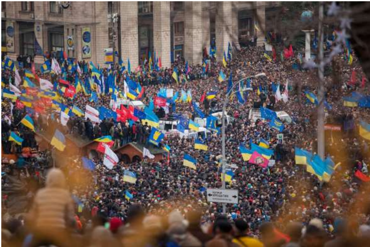
Euromajdan i Kyiv 1 december 2013.

Varken ockupationen av olika ministerier, dessa var temporära, eller ockupationen av olika byggnader på och i närheten av Majdan var något som konsulterats med ledarna för de tre politiska partier som formellt stod i spetsen för hela demonstrationen och definitivt inte med dem alla tre. Självklart skapade detta faktum förvirring och det underlättade säkert heller inte förhandlingarna med Viktor Janukovytyj som inför varje sådan handling erhöll argument för sin allt hårdare ståndpunkt. Detta fråntar inte Janukovytyj det fullständiga och enda ansvaret för det våld som brukades under dessa ödesdigra månader.