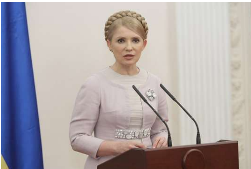
Tymosjenko i november 2009.

Det står utom allt tvivel att de politiker som stod i ledningen för den orangea revolutionen fullständigt misslyckades med den uppgift de tagit på sig när de hand i hand stod på scenen på Majdan vintern 2004. Ingen av dem kan svära sig fri från ansvaret. Det gäller socialistledaren Oleksandr Moroz, nuvarande presidenten Petro Porosjenko och revolutionens kanske främsta symbol, Lady Ju, Julia Tymosjenko. Det tyngsta ansvaret faller likväl tillbaka på president Viktor Jusjtjenko som visade sig vara en politiker som ej förmådde att leva upp till det ansvar som han fått — att förvalta väljarnas och de tålmodiga och disciplinerade demonstranternas förtroende.