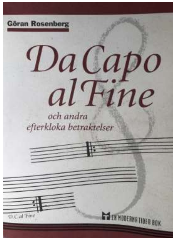
Da Capo al Fine (Moderna tider, 1994)

Göran Rosenbergs nya bok, Da Capo al Fine och andra efterklöka betraktelser , har uppmärksammats en hel del som en "syndabekännelse" från en före detta "vänsterist". I likhet med när Per Ahlmarks bok Vänstern och tyranniet publicerades i början av året, har Rosenbergs bok gett upphov till en strid ström av kommentarer, halvsanningar och rena lögnar. Sällan är det så många okunniga "experter" och "kännare" som uttalar sig i massmedia som när detta ämne kommer på tapeten.