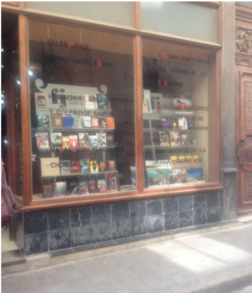
Bokhandel i Havanna. Lite av varje finns att läsa – även Trotskij

Om Trotskij-konferensen i Havanna (i maj 2019) , artiklar ur internationell vänsterpress