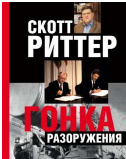
Ryska upplagan av Ritters bok

Ritter har gjort Putins Ryssland många tjänster, som man i Moskva också är tacksamma för, vilket visas av att han under maj 2023 var inbjuden till Ryssland, bl a för att presentera sin senaste bok, som översatts till ryska ( Гонка разоружения , Nedrustningskapplöpningen). Han