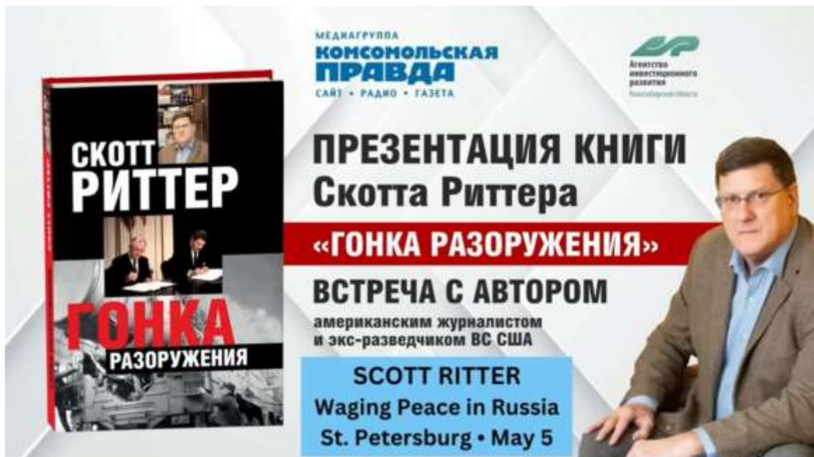
Reklam för framträdande av Ritter i S:t Petersburg