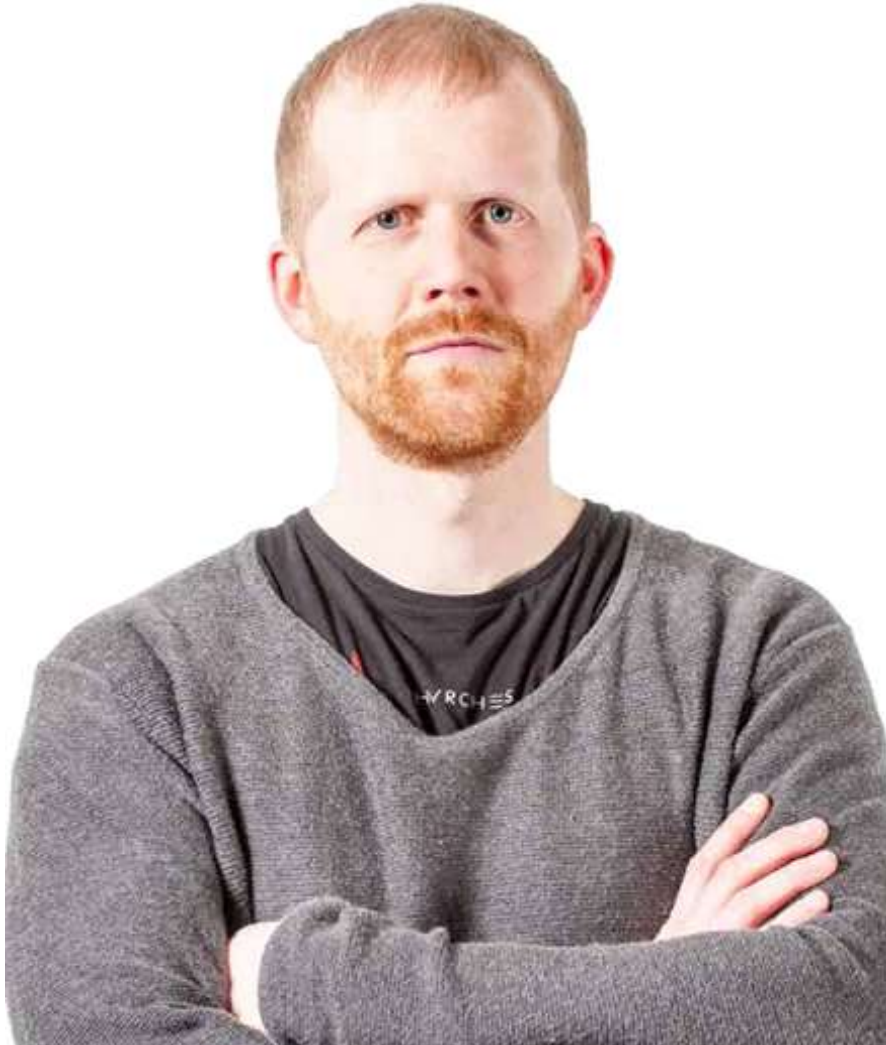
Humanekologen Andreas Malm.