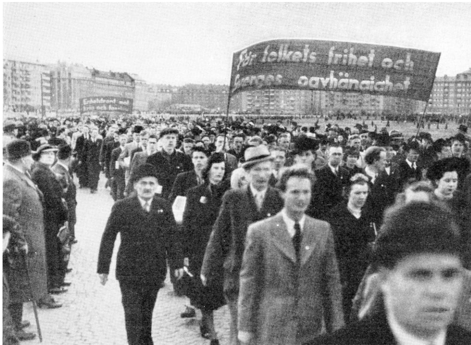
SKP:s avdelning i 1-majdemonstrationen i Stockholm 1939

Traditionellt hade SKP organiserat egna 1-majdemonstrationer, men 1938 försökte man bryta den traditionen och demonstrera ihop med socialdemokraterna, vilket lyckades delvis. I januari 1939 beslöt man så att överhuvudtaget inte tillåta sär demonstrationer ”för att övertyga övriga arbetare om vår ärliga vilja att skapa en demokratisk kampfront”. 3 Kommunisternas huvudparoll i 1939 års 1-majdemonstrationerna var ”För folkets frihet och Sverges oavhängighet” – samma ord som Sven Linderot avslutade sitt kongresstal med och som även ingår i talets rubrik (se ovan).