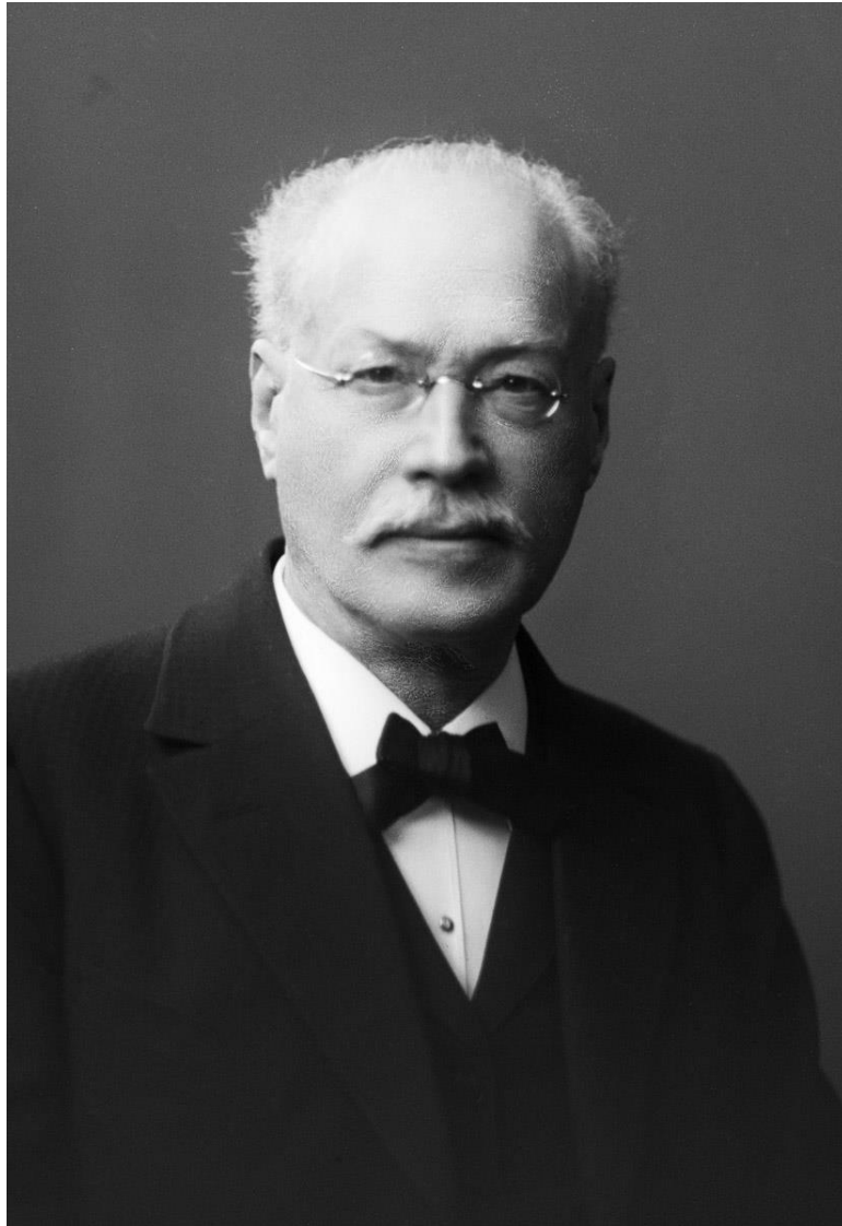
Hinke i närbild. Ungsocialisterna.