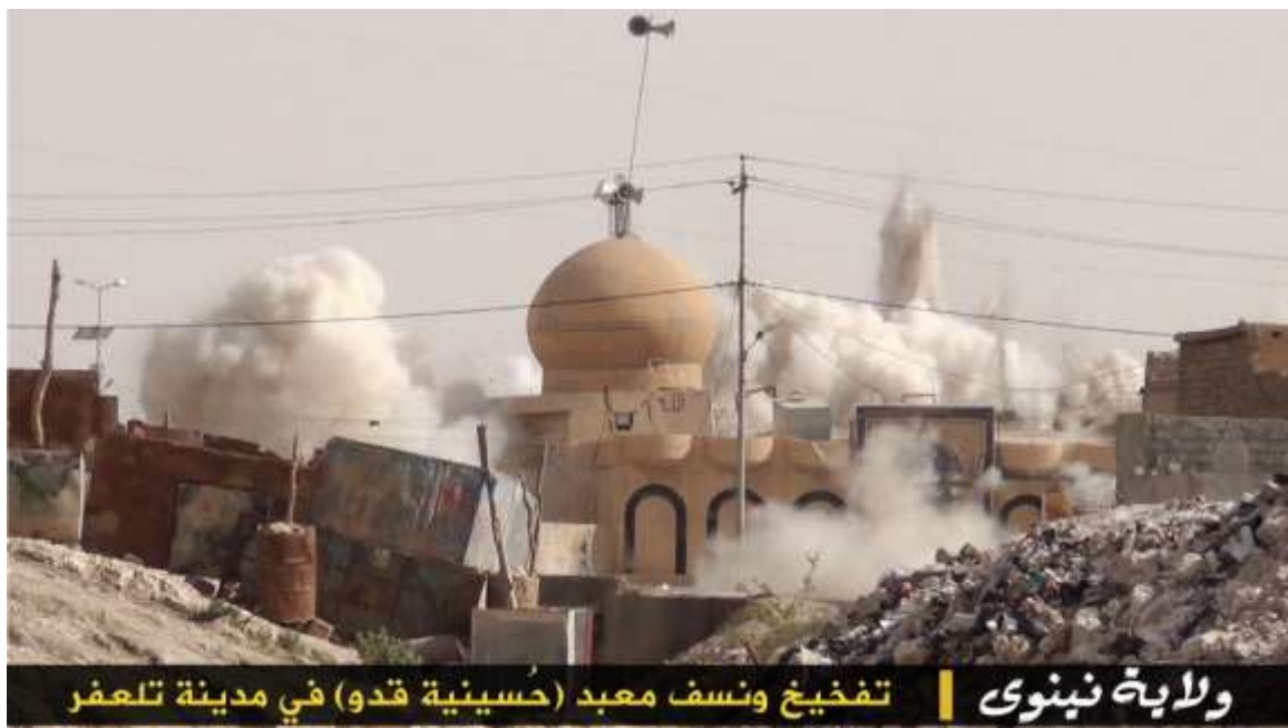
IS spränger shiitisk helgedom

Hur ska då det gå till? Det finns dessvärre inget enkelt svar på den frågan.