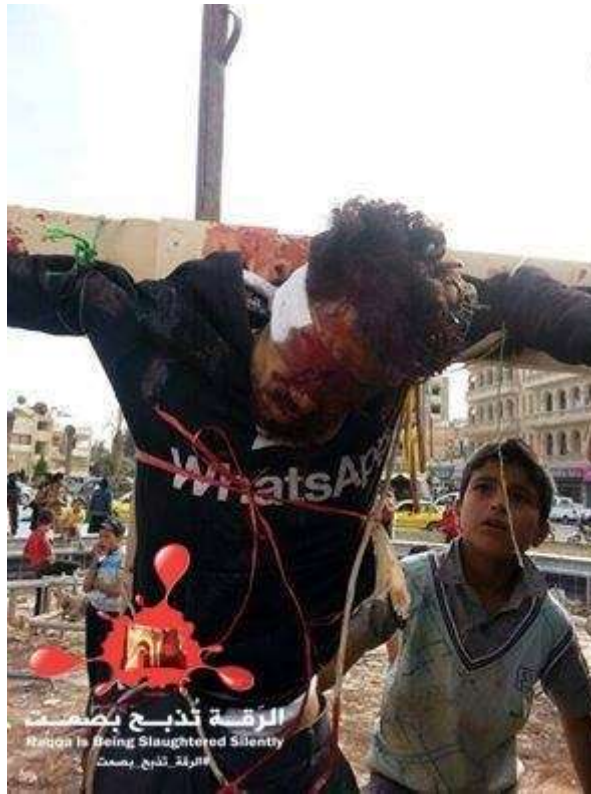
Korsfäst fånge i Raqqa

Och allra sist: En grundförutsättning för att kunna ta itu med att lösa de stora problem som nu tornat upp sig, är att man begriper deras vidd och rötter. Dagens utveckling var inte oundviklig. Den hade kunnat vändas om fler förstått vilka faror som stod för dörren och dragit riktiga slutsatser av det. Men varningsklockorna klingade utan att särskilt många tog dem på allvar eller ens noterade dem. Det är alltså hög tid att ta itu med sådana frågor, för att stå bättre rustade i framtiden.