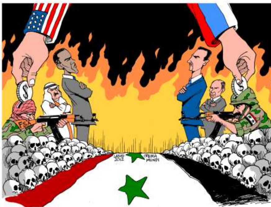
Så här kan man också se på Syrien-konflikten

mycket farligt. Om vi hade befunnit oss inne i Syrien eller dess närmaste omgivning där vapnen talar, då hade det varit begripligt (och förmodligen lett till ”vapnets kritik”), men i Sverige där den lilla utomparlamentariska vänsterns åsikter och förehavanden knappast får några konsekvenser överhuvudtaget för kampen i Syrien eller ens påverkar den svenska opinionen, så är detta närmast absurt, och borde för en sansad utomstående bedömare närmast framstå som löjeväckande, som ett uttryck för den svenska utomparlamentariska vänsterns sekterism, brist på självinsikt och grumliga verklighetsuppfattning.