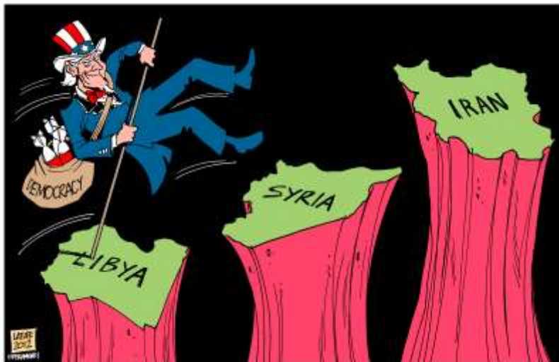
Ett sätt att se på USA:s politik i Mellanöstern – slutmålet Iran

Den första linjen – "folket mot Assad" – tycks förutsätta att hela folket står emot Assad-regimen. All politisk kamp för att vinna majoriteten är bortdefinierad redan från början! Man förnekar inte att "folket" består av olika klasser, olika nationella/religiösa/etniska grupper m m, liksom att utländska intressen är inbegripna, men man anser att detta är irrelevant i den aktuella situationen och att försök att ta upp sådant bara tar bort fokus från det primära, upproret. Att t ex mindre trevliga strömningar (t ex religiösa fundamentalister) kan stärka sin ställning – och kanske t o m gå segrande ur upproret – eller att omgivande stater liksom imperialistiska stormakter med USA i spetsen försöker vinna inflytande och styra upproret – förnekas inte heller, men det anses inte vara något som vi under rådande omständigheter kan ta hänsyn till eller försöka göra något åt. Allt motstånd mot Assad-regimen (även från fundamentalistiska jihadister) ses som positivt. Man driver ingen självständig politisk linje för själva upproret, man har inga råd att ge de progressiva, sekulära krafterna utan hoppas att all ska gå rätt väg ändå – den som lever får se.