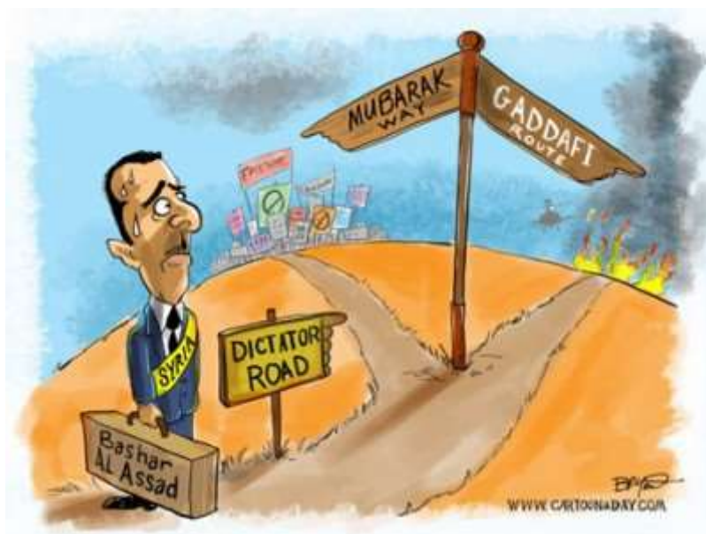
Bashar al-Assads vägval

Göteborg 9/1 2013. Samlingen kompletterad med text från Arbetarmakt 10/1. Martin F