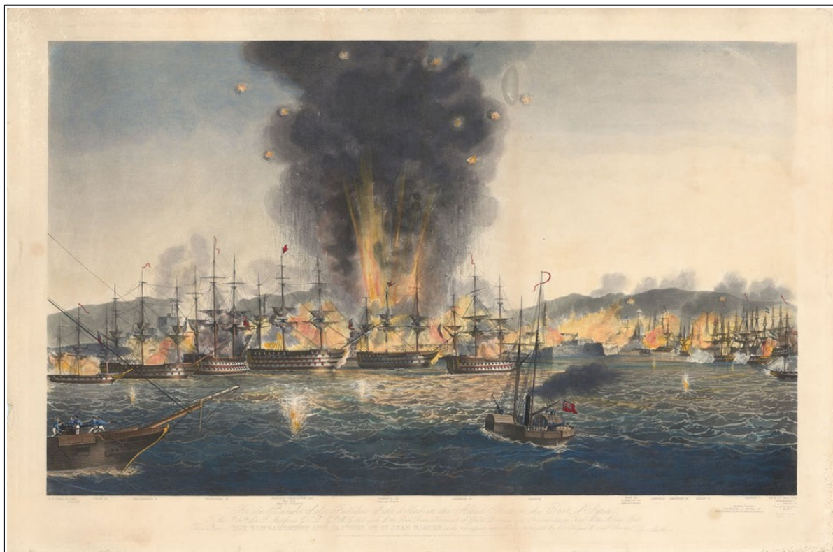
”Bombardemanget och erövringen av St. Jean D’Acre”. John Frederick Warre, 1841.

några minuter avbröt ingenting den skrämmande tystnaden utom ekona från bergen som upprepade ljudet som mullret från en avlägsen åska, och ibland ljudet av en fallande byggnad. 32