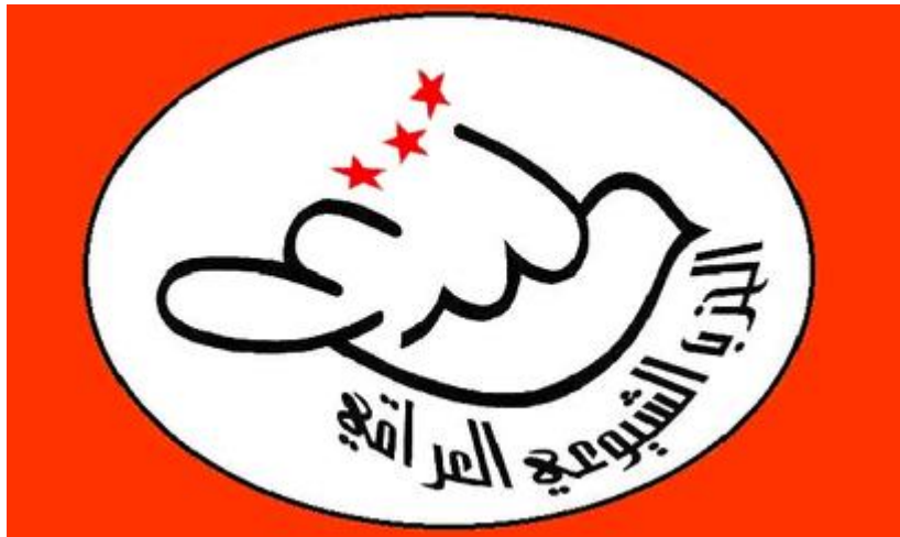
Flagga med IKP:s logo