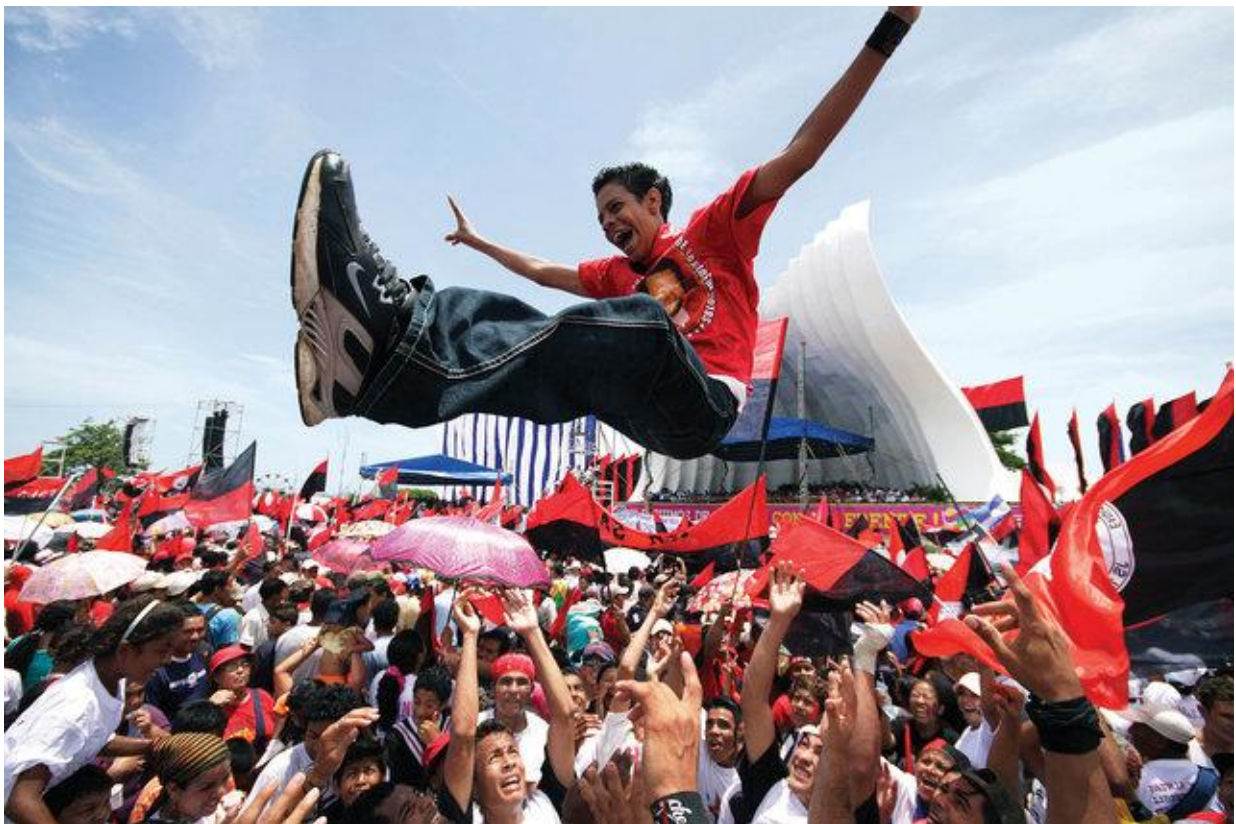
Sandinist-anhängare i Managua, Nicaragua, som 19 juli 2009 firade 30-årsdagen av revolutionen som 1979 störtade Somoza-regeringen.

Artikeln har även publicerats i Internationalen nr 51-51/2019. Översättning: Björn Erik Rosin Martin Fahlgren