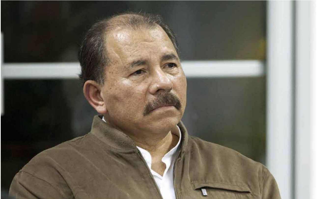
NU Daniel Ortega som gammal president.

Det är viktigt att framhålla att förslag om en alternativ politik lades fram både inom och utanför FSLN. Konstruktiva kritiska röster väntade inte på bakslaget i valet 1990 för att föreslå nya riktlinjer, men de fick inget större gensvar och förblev relativt isolerade.