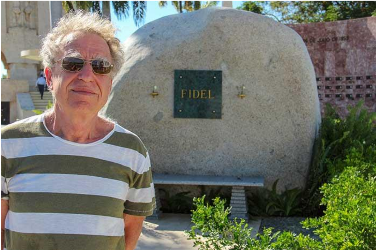
Artikelförfattaren framför Fidels grav i Santiago de Cuba.

Om inget annat sägs är bilderna © artikelförfattaren. Lästipsen i slutet har tillagts av marxistarkivet.