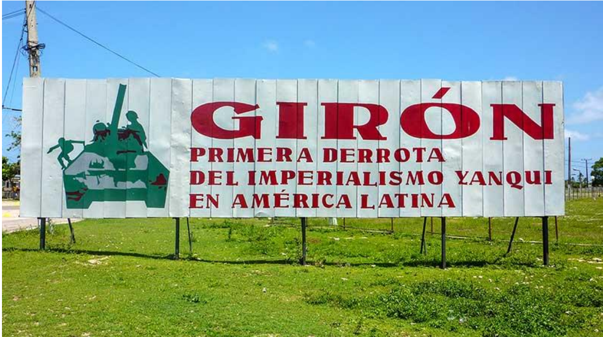
Girón vid Grisbukten, USA-imperialismens första nederlag i Latinamerika.

Kubanerna har hela tiden kunnat bli av med USA:s blockad och det militära hotet som hänger över dem. Så är det också nu. Det "enda" Kuba behöver göra är att lägga sig platt för USA:s regering och de kapitalistiska bolagen. Inget talar för att kubanerna kommer göra detta. Och någon intern kontrarevolutionär kraft, som skulle kunna slå upp portarna för imperialismen, är inte skönjbar.