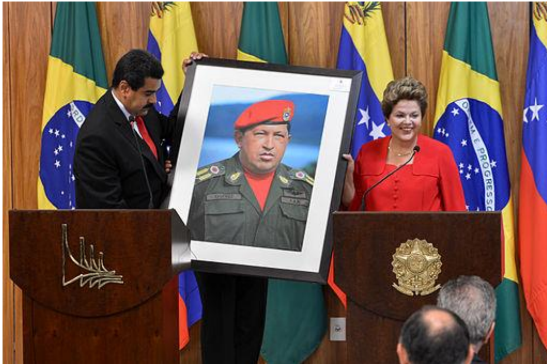
Nicolás Maduro överlämnar ett porträtt av Hugo Chávez till Dilma Rousseff.

Historien följer inga raka linjer. Ett nederlag kan vändas till seger. Liksom en seger kan visa sig obeständig. Inför de folkliga framgångarna i Latinamerika satte USA och dess allierade in en våldsam motoffensiv. Presidenter störtades i Haiti 2004, i Honduras 2009 (Obamas nya strategi, påhejad av Hillary Clinton) och i Paraguay 2012. Kuppförsök gjordes mot alla de radikala regeringarna. Det var inte i val som vänstern besegrades, utan av "lawfare", en allians mellan USA, överklassen, juridiken och media. Dessa anklagade vänsterpolitiker, utan bevis, som korrupta och har, ofta med militant stöd från stora delar av medelklassen, lyckats avsätta eller fängsla dem. Högerregimer har kommit till makten i Ecuador (där vänsterkandidaten Moreno efter att ha blivit vald överraskande bytte sida till imperialismens och högerens sida) i Argentina, i Chile med flera. Den latinamerikanska integrationen har gått i stå.