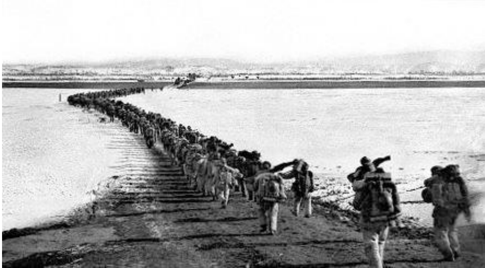
I oktober 1950 ingrep kinesiska trupper i Koreakriget (här korsar de Yalu-floden)

Koreakriget startade i slutet av juni 1950 och pågick till slutet av juli 1953, då man slöt vapenstillestånd, vilket fortfarande gäller, dvs något fredsfördrag har ännu inte undertecknats.