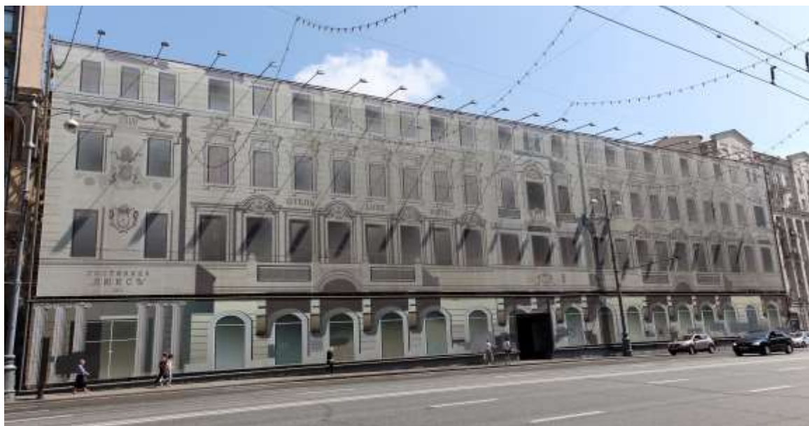
Hotell Lux i Moskva