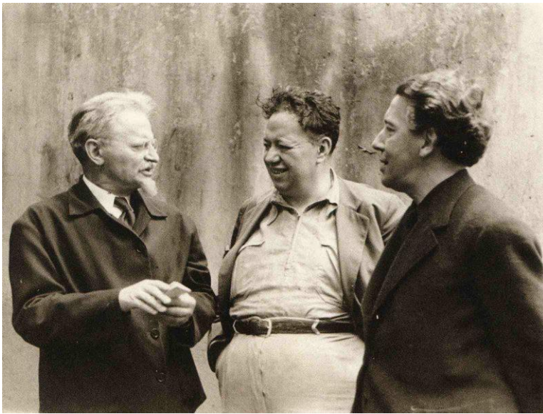
Trotskij, Diego Rivera och författaren André Breton i Mexiko 1938

T R Poole går igenom följderna av affären Beals, Trotskij's reaktioner och Diego Riveras protester hos redaktören för Modern Monthly , där Carleton Beals medarbetade. V F Calverton 56 , tidskriftens chefredaktör, ville inte ge vika och hans definitiva brytning med Trotskij gick att spåra till denna incident.