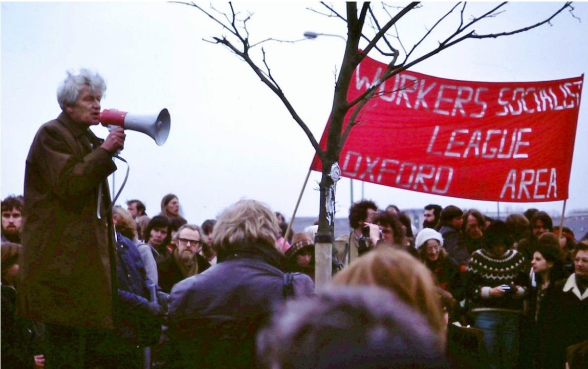
E P Thompson (1924-1993)

Den följande artikeln, som utgjorde efterskrift till Thompson-antologin Herremakt & folklig kultur (1980), är ett försök att sammanfatta den brittiske marxistiske historikern E P Thompsons betydelse och roll i den brittiska vänstern. Thompson är mest känd för sitt arbete om den brittiska arbetarklassens framväxt, The Making of the English Working Class , vars första upplaga kom ut 1963, men som kommit ut i många utgåvor sedan dess. Han skrev dock en hel del andra viktiga arbeten och deltog livligt i den brittiska vänsterdebatten, bl a polemiserade han under många år med Perry Anderson, tidskriften New Left Reviews redaktör. Thompson skrev också en grundlig kritik av den franske marxistiske filosofen Althusserns uppfattningar 1 , något som tas upp ganska utförligt i artikeln nedan.