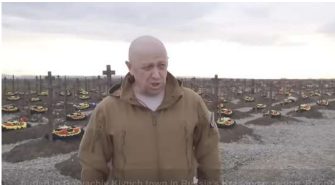
Prigozjin stående framför en av Wagnergruppens begravningsplatser (från video)

Prigozjin har emellertid varit den effektivare fascistiska propagandisten under detta krig, där han på ett strategiskt sätt använder våldssymboler (en slägga 2 ) och bilder av död (begravningsplatser, verkliga lik) för att stärka sin ställning. Wagnergruppen inrymmer ett stort antal öppet fascistiska krigare. Wagners konflikt med Sjojgu har rasistiska övertoner och undertoner – i Wagnervänliga telegramkanaler kallas han ”den degenererade Tuva” och liknande.