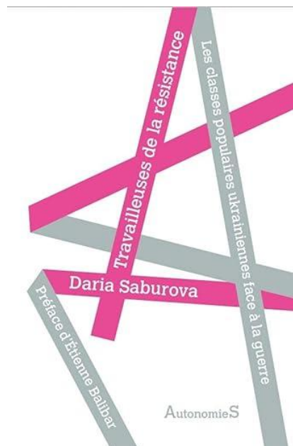
Daria Saburova: Travailleuses de la résistance (2024)

Inledningsvis riktade sig boken främst till en fransk publik. Förordet skrevs av Étienne Balibar, som anknöt till den aktuella debatt som pågick i Frankrike om kriget i Ukraina.