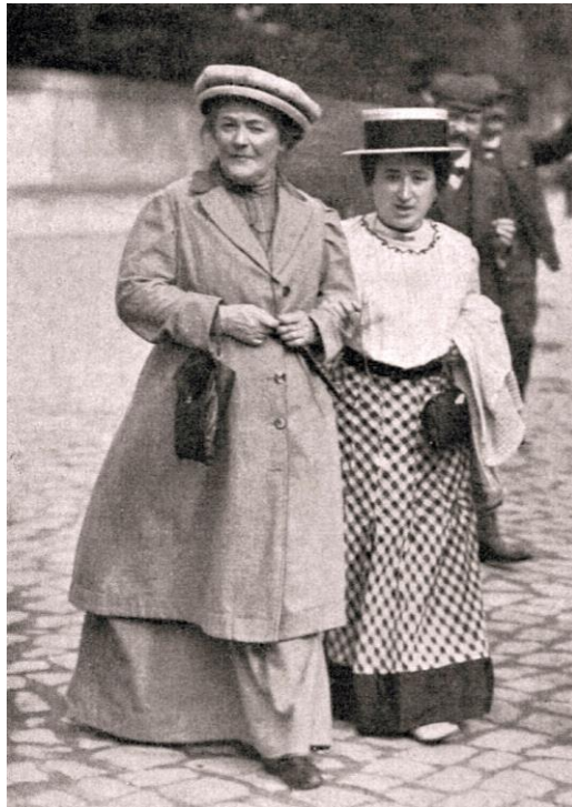
Clara Zetkin och Rosa Luxemburg 1910

Ur Links International Journal , 7/5 2019