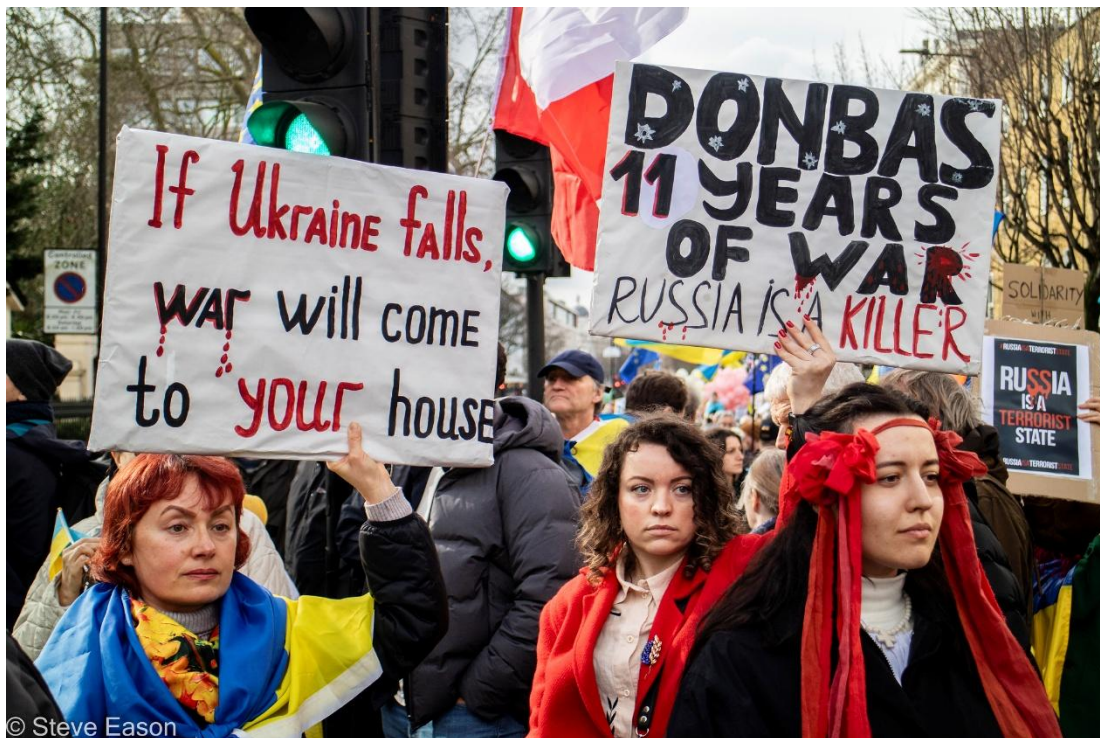
Demonstration i London på treårsdagen av Rysslands invasion, februari 2025.

Frågan hur eller om socialister i Europa tar sig an de politiska och praktiska utmaningar som Rysslands krig innebär ligger säkert väldigt långt ner på listan över saker som de flesta ukrainare funderar över just nu.