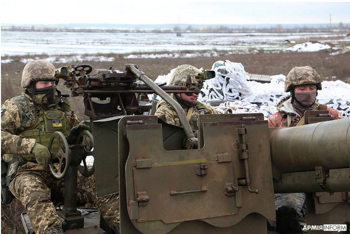
Ukrainska soldater med luftvärnskanon, Rivne, april 2023.

En brittisk politiker har försiktigt antytt att det finns bra och dåliga vapenleveranser: John Swinney, Skottlands försteminister. I september förra året hävde han restriktionerna kring användning av offentligt stöd till ammunitionsproduktion ”mot bakgrund av Rysslands invasion av och fortsatta krig mot Ukraina”, men blockerade nya anslag av offentliga medel till försvarsföretag som handlar med Israel, på grund av ” trovärdiga bevis på folkmord” i Gaza.