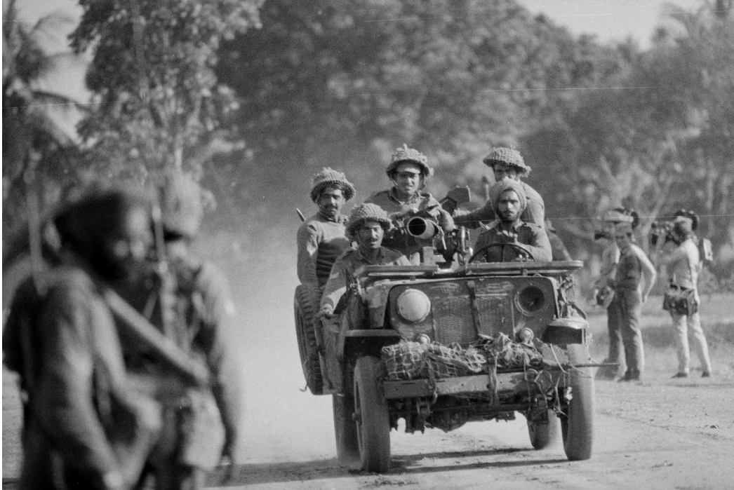
Den indiska armén intar Jessore i Bangladesh, 1971.

Naturligtvis finns det politiska skäl att vara försiktig med att fokusera på vapenleveranser, vilket har att göra med vår övergripande inställning till militarism och vår inställning till staten.