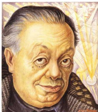
Diego Rivera – ett självporträtt

Det finns inget eller mycket litet som tyder på att Rivera skulle ha brutit med Trotskij av svartsjuka, hämndbegär eller liknande. Historiska fakta implicerar att brytningen främst hade politiska orsaker.