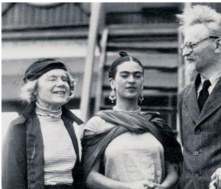
Natalia Sedova, Frida Kahlo och Trotskij