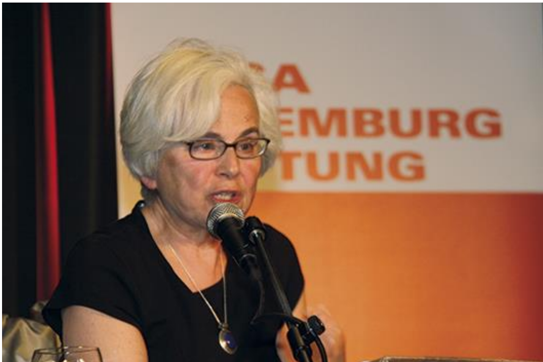
Ellen Meiksins Wood i Berlin 2012 (inbjuden av Rosa Luxemburg Stiftung)