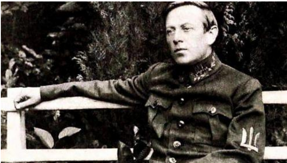
Symon Petljura 1879 – 1926

Den 21 januari 2019 invigde vice premiärministern och kulturministern en basrelief föreställande Symon Petljura vid n° 2-4 på den gata som bär hans namn i Kiev. Petljura var 1918-20 chef för de nationalistiska styrkorna i Ukraina. Myndigheterna i Ukraina betraktar Petljura som en nationalhjälte och han har redan förärats en staty i Vinnytsja, sydost om Kiev, som invigdes i oktober 2017. Fast Petljura var ändå den som ledde pogromer där tiotusentals judar dödades.