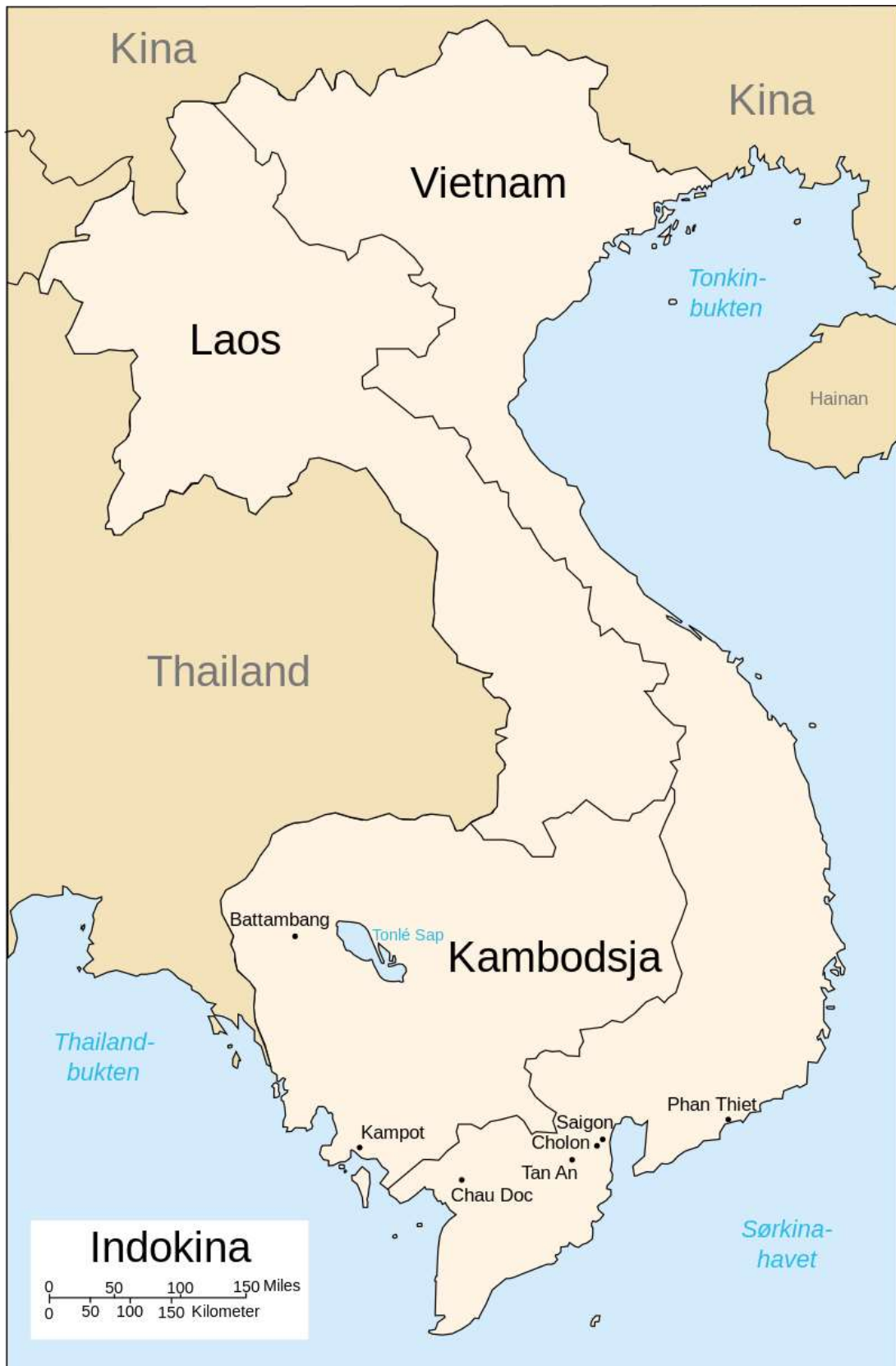
Kambodja och dess grannländer

kambodjansk bastardkultur” som hemsöktes av ”indifiering och indifierande myter”. 14