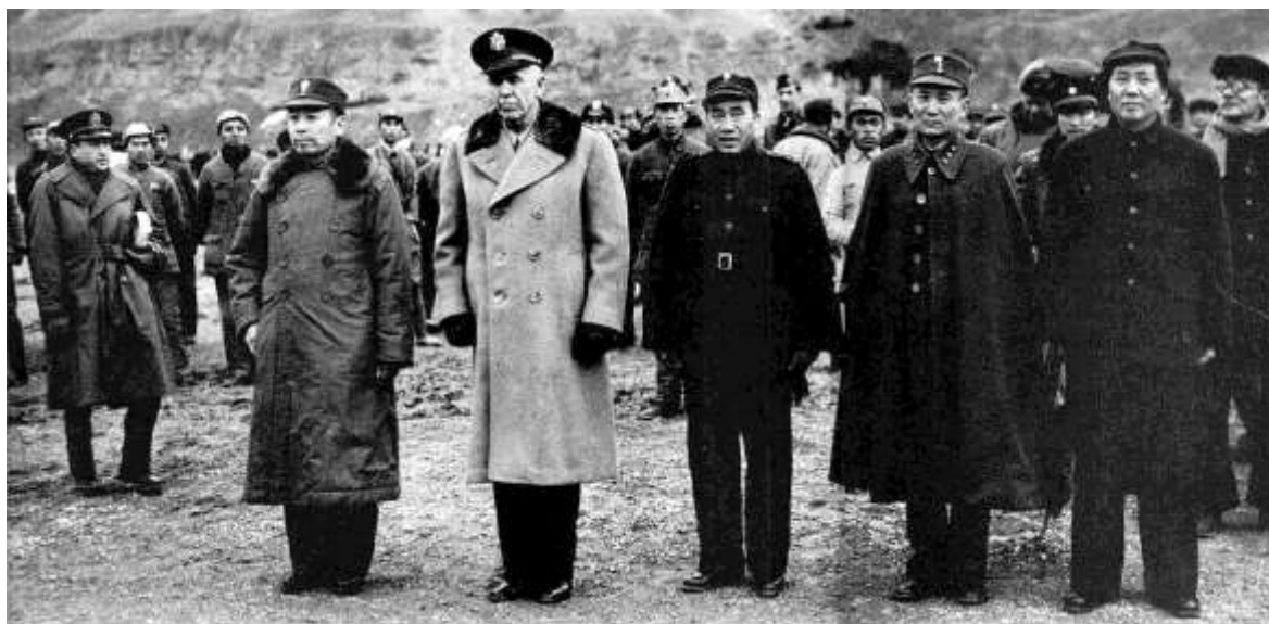
Zhou Enlai, general Marshall, Zhu De, Zhang Zhizhong och Mao Zedong i Kina, mars 1946

Presidenten gav för kort tid sedan en redogörelse för utvecklingen i Kina under det gångna året och för den amerikanska regeringens inställning till Kina. Jag ser mig av omständigheterna nu tvingad att komplettera denna redogörelse med egna förstahandsintryck.