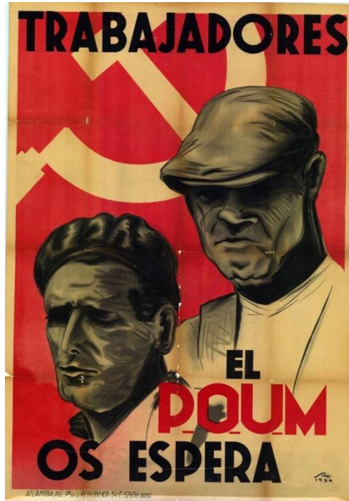
POUM-affisch från 1936.

Samma process pågick i Katalonien, där POUM 6 hade gått in i koalitionsregeringen, vilken de utropade som en arbetarregering. Men POUM förklarade samtidigt att inbördeskriget i grunden var en fråga om socialism eller kapitalism, en sanning som underminerar folkfrontens själva grundvalar. Republikaner och stalinister enades i en avskryvård förtalskampanj mot POUM och anklagade dem för att vara köpta av Franco, drev ut dem ur regeringen, stoppade deras propaganda och tidningar och arresterade och fängslade deras ledare.