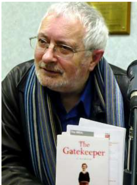
Eagleton i Manchester 2008

Man är inte kristen bara för att man är marxist, inte marxist bara för att man är rolig och inte rolig bara för att man är kristen, men förhållandet mellan dessa tre egenskaper är en nyckel till Terry Eagletons tänkande. Det menar Ola Sigurdson 1 i sitt bidrag till Röda rummets serie över samtida marxism.