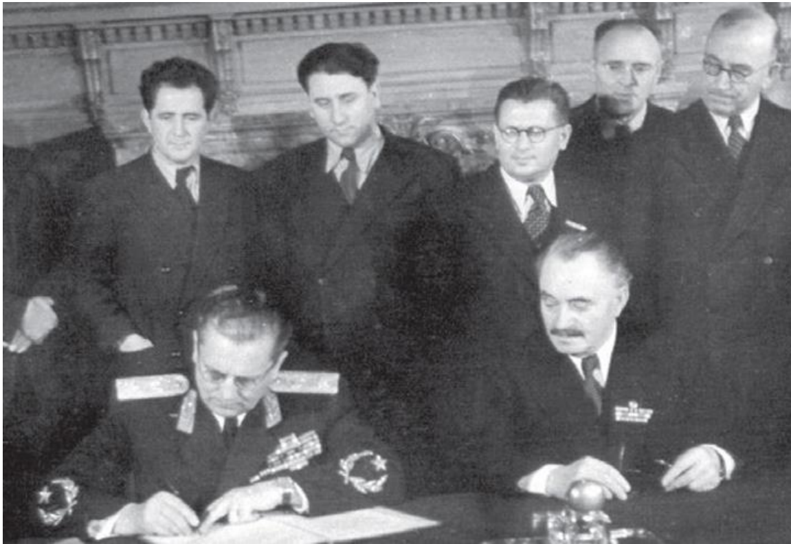
Tito och Dimitrov undertecknade Bled-avtalet 1 augusti 1947