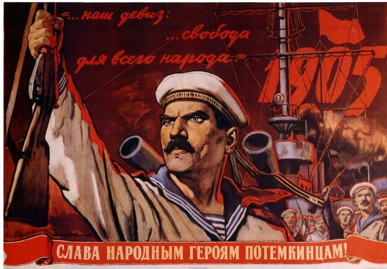
Affisch till minne av myteriet på pansarkryssaren Potemkin i juni 1905

[ Detta kapitel behandlar tiden från 1905 års ryska revolution och fram till början av 1917, då en ny rysk revolution inleds ]