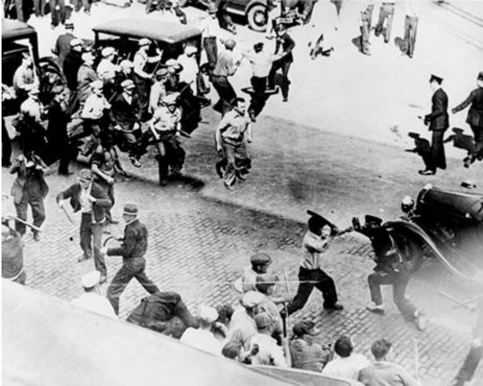
Sammandrabbning mellan strejkande arbetare och polis i Minneapolis