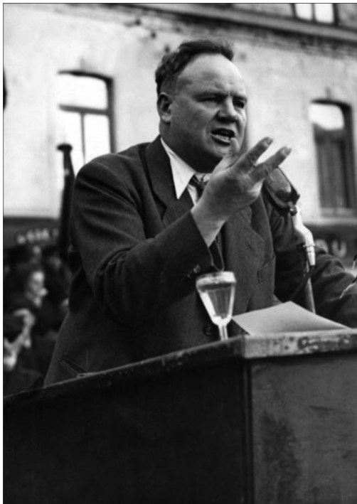
Maurice Thorez (1900-1964)

Knappt två år senare, återigen i Moskva, vid Kominterns sjunde kongress, skulle samme Thorez bli höljd i beröm. En glädjestrålände ”Maurice” som placerats vid Stalins högra sida, [...] hade fått tillträde till den Stalinkult, som var förbehållen de happy few som denne själv valt ut. 6