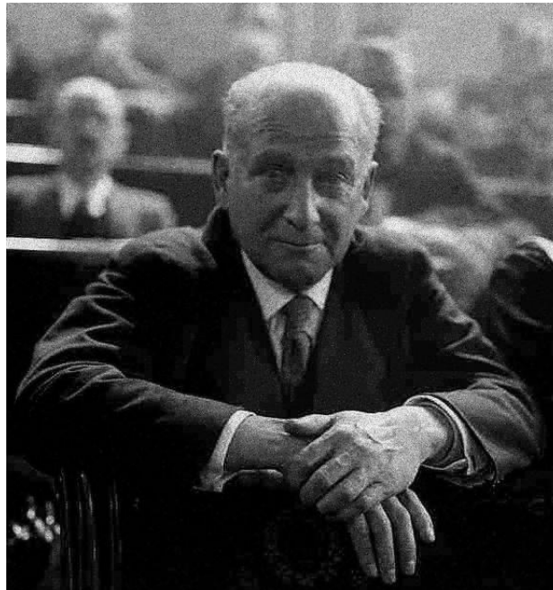
Francisco Largo Caballero (1869-1946)