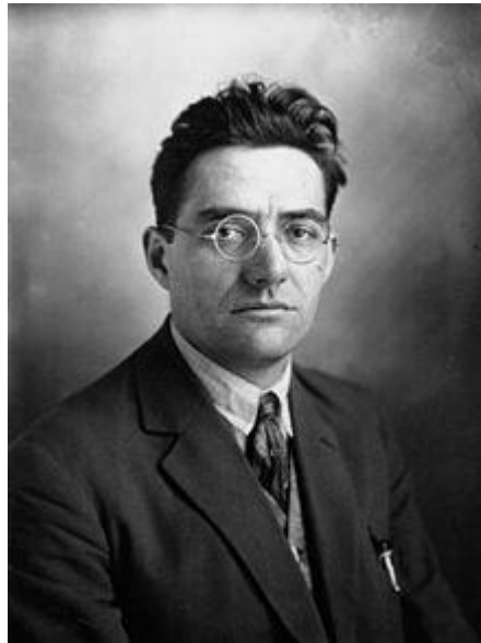
Jacques Doriot (1896-1945)

Doriots modiga agerande under gatustriderna den 9 och hans otvetydiga ställningstagande för en enhetsfront mellan socialister och kommunister gjorde honom till ledare för den ”enhetsinriktade” oppositionen gentemot den självmordsmässiga politik som Komintern dikterat, en ledare som rent av skulle kunna bli en fanbärare internationellt. Vid ett stort möte på teatern i [Parisförorten] Saint-Denis, där han var borgmästare väckte parollen om ”en enda arbetarklass, ett enda CGT, ett enda arbetarparti” jubel bland de församlade och man utsåg en ”en antifascistisk övervakningskommitté”, som han ville göra till ”en kommitté som ledde arbetarklassens aktioner mot fascismen i Saint-Denis”. Han uppmanade till bildande av sådana kommittéer över hela landet. Han skrev ett ”Öppet brev till Kommunistiska internationalen”, som fördömde Kominterns politik och försvarade och målade upp nödvändigheten av en enhetsfront. Men han var heller inte främmande för motsägelser: samtidigt som han kritiserade bruket av enhälliga beslut inom kommunistpartiet skapade han med L'Emancipation ett diskussionsforum, som inte publicerade en enda artikel från motståndarsidan!