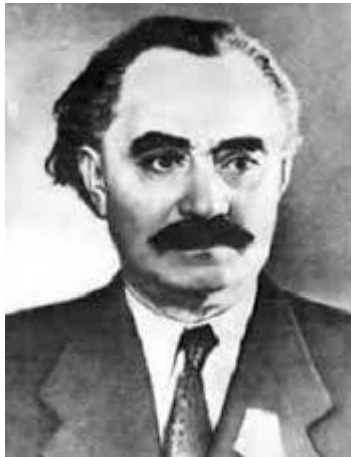
Dimitrov i mitten av 1940-talet

Den 31 maj meddelade Dimitrov Stalin att det slutligen var möjligt att offentliggöra att upplösningen godkännts av en förkrossande majoritet av kommunistpartierna. Den 5 juni hade svar inkommit från 29 av de 41 sektioner som rådfrågats. Den 8 juni godkände det grekiska partiet förslaget, som man betecknade som ett erkännande av partiernas mognad och ett överförande av ansvaret till dem. Dimitrov föreslog Stalin att presidiet skulle sammanträda den 8 juni. Då skulle inte bara upplösningen av Komintern tillkännages utan också utses en kommission ledd av honom själv och med följande medlemmar: Manuilskij, Pieck, Ercoli, Konstantin Sucharev, chef för avdelningen för ekonomiska operationer, för att senast den 1 augusti organisera upplösningen av strukturer och Kominterns egendom. Så skedde också och Kominterns presidium tillkännagav att ingen sektion motsatt sig förslaget och att enhällighet uppnåtts bland de sektioner som haft möjlighet att svara. Han förklarade exekutivkommittén, presidiet och sekretariatet samt kontrollkommissionen upplösta från den 10 juni och bildade den tänkta kommissionen under Dimitrovs ledning för att slutligt avsluta Kominterns affärer. Den 9 juni skickade Dimitrov, som tecken på att Stalin var överens, den definitiva resolutionstexten till Pospelov, Pravdas chefredaktör.