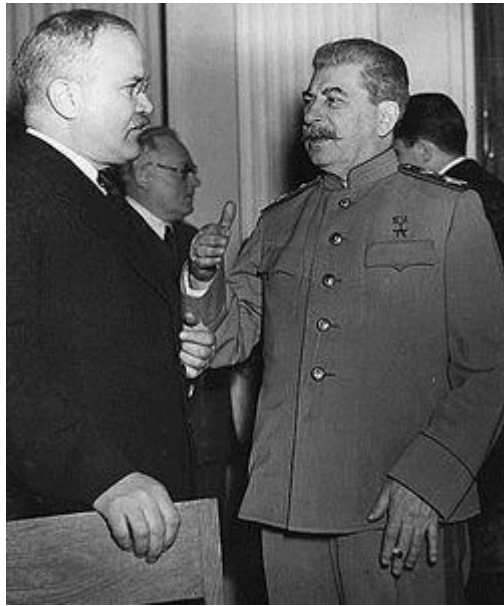
Molotov och Stalin