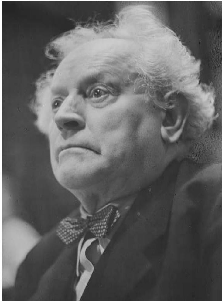
Martin Andersen Nexø

Den danske författaren Martin Andersen Nexø (1869-1954) var en centralgestalt i den genre som brukar kallas arbetarlitteratur eller proletärlitteratur. Att hans inflytande var stort visas av att många av hans verk spreds långt utanför hemlandets gränser. Hans mest lästa roman Pelle Erövraren (i 4 volymer) översattes till över 25 olika språk och alla hans böcker kom ut på svenska. Han förekom också ofta i svensk press, särskilt i Skåne.