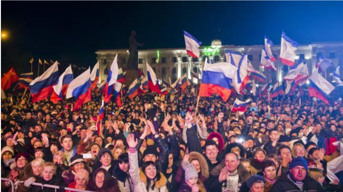
Firande i Simferopol i samband med folkomröstningen på Krimhalvön.

Upprördheten må vara äkta, men argumentationen är minst sagt hycklande.