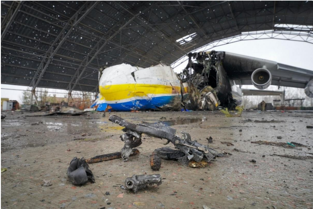
Vraket av världens största transportflygplan. Foto: Oleksandr Ratushniak. Licens CC BY-SA 4.0.

Stridsvagnskolonnerna var på väg mot Kiev, men truppernas uppgift hade blivit avsevärt svårare.