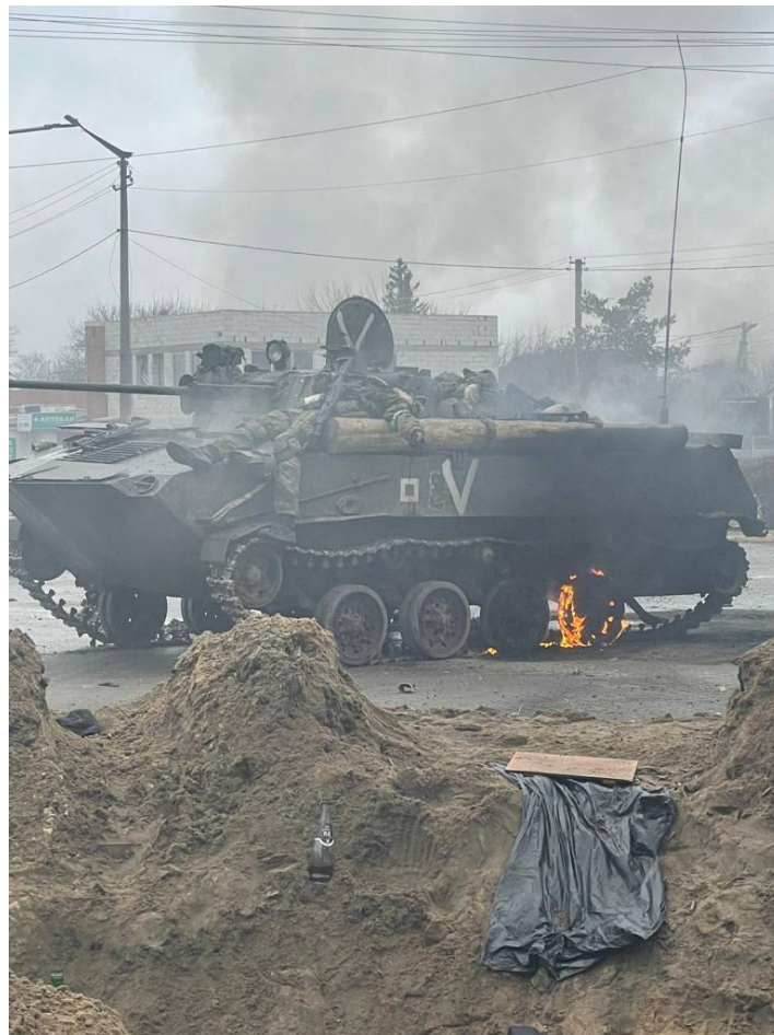
Döda ryssar på ett skadat BMD-2 pansarskyttefordon under slaget om Hostomel. Licens CC BY- 4.0

De ryska transporthelikoptrarna började landsätta trupper längre bort från landningsbanan, vid skogsbrynet norr om Hostomel. VDV-styrkorna ryckte fram i diamantformation. De var beväpnade med automatkarbiner, granater, kulsprutor och pansarskott. Det var uppenbart att de var yrkessoldater – de var vältränade och utnyttjade terrängen.