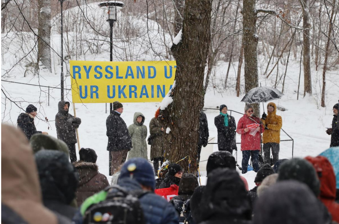
På Fria Ukrainas plats kan Gunnar Hökmark och gamla trotskister skaka hand åtminstone tills det blir fred.

I källargångar under Kupjansk förs ett utnötningskrig mot ryska drönare och artilleri. I Stockholm förs en annan strid: om vänsterns rätt – och skyldighet – att stödja ett land som slåss för sitt självbestämmande, även med vapen.