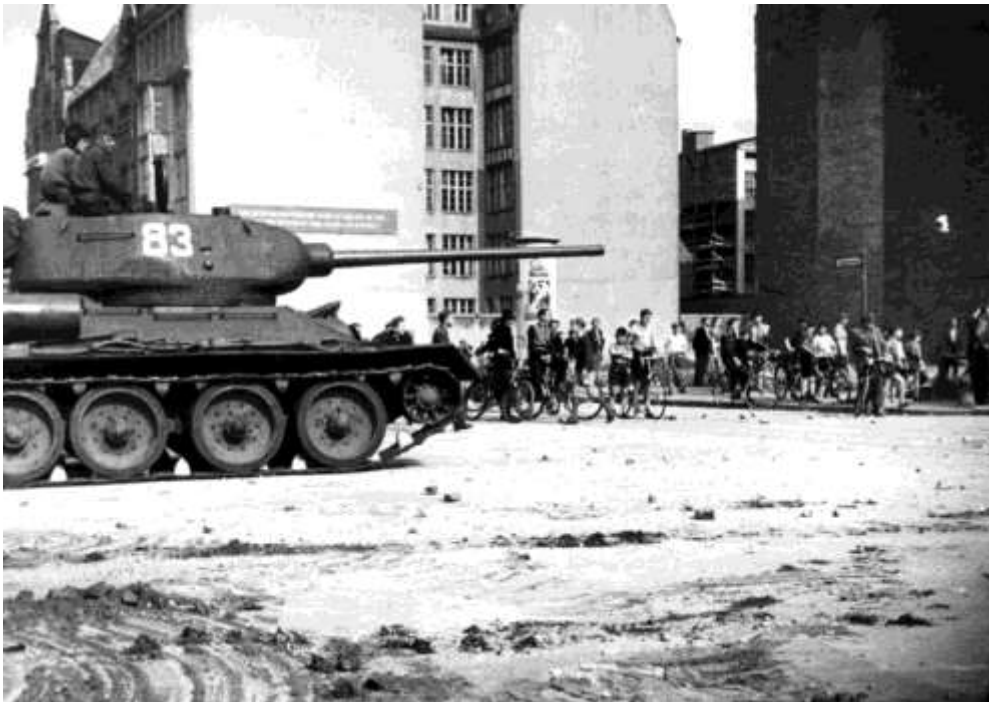
Sovjetisk stridsvagn i Berlin

17 juni är 400 000 ute i strejk, varav 100 000 i Östberlin. Folkpolisens kedjor bryts, Volkspolizeis högkvarter Columbushaus ockuperas och sätts senare i brand. SED-funktionärer flyr undan massornas vrede och söker skydd hos den västberlinska polisen.