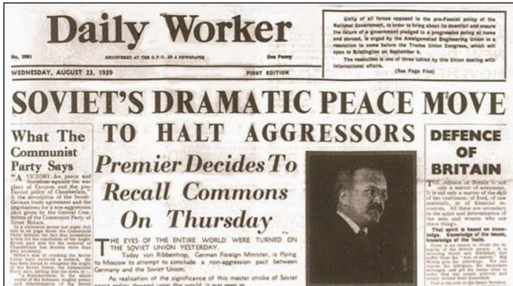
Daily Worker (brittiska KP:s tidning) 23/8 1939 om förhandlingarna i Moskva