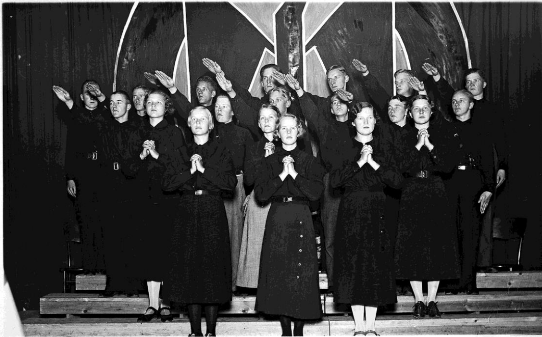
Fosterländska Folkrorelsens ungdomsförening De blåsvartas recitationskör på turné i mitten av 1930-talet. Bild ur boken.

Forskartrions nyutkomna bok behandlar inte denna episods historia men fastslår att det runt den finländska fascismen har det i årtionden rått en märklig omertà i en tigandets och förklenandets kultur. 3 Ett antal separata undersökningar har visserligen publicerats. Men en heltäckande framställning över den finländska fascismen har det inte funnits.