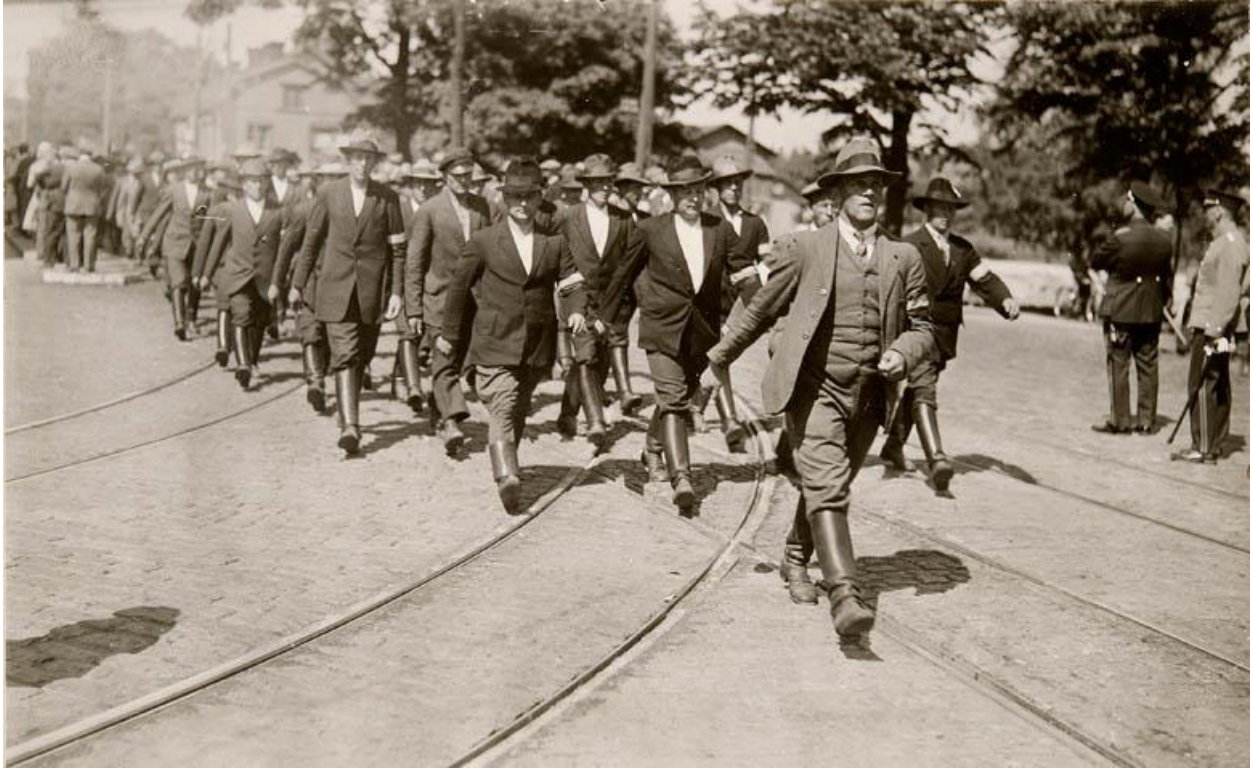
Av Lapporörelsen organiserad bondemarsch 7 juli 1930