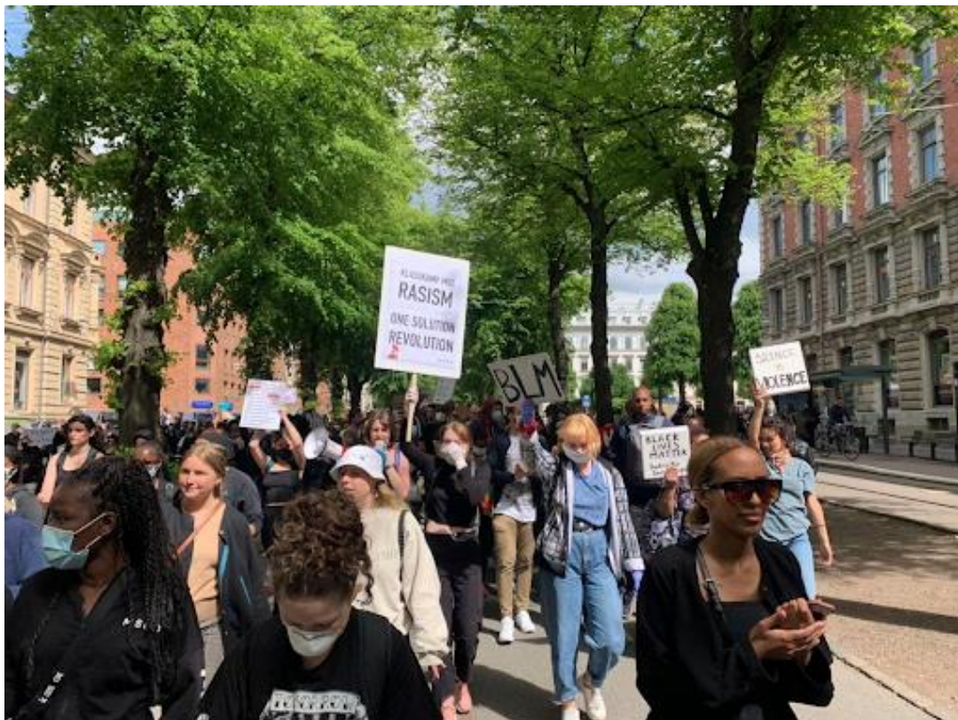
Tusentals tågar genom staden efter polisen upplöst demonstrationen på Heden.

I söndags slöt över 3000 unga och arbetare upp i Göteborg för att demonstrera under parollen ”Black Lives Matter”. Stämningen var radikal och budskapet tydligt: ”No Justice, No Peace, No Racist Police!”