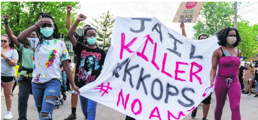
Demonstranter i Minneapolis, USA

Om protesterna och Black Lives Matter-rörelsen ska bli början på en amerikansk vår får antirasismen inte skiljas ut från klasskampen.