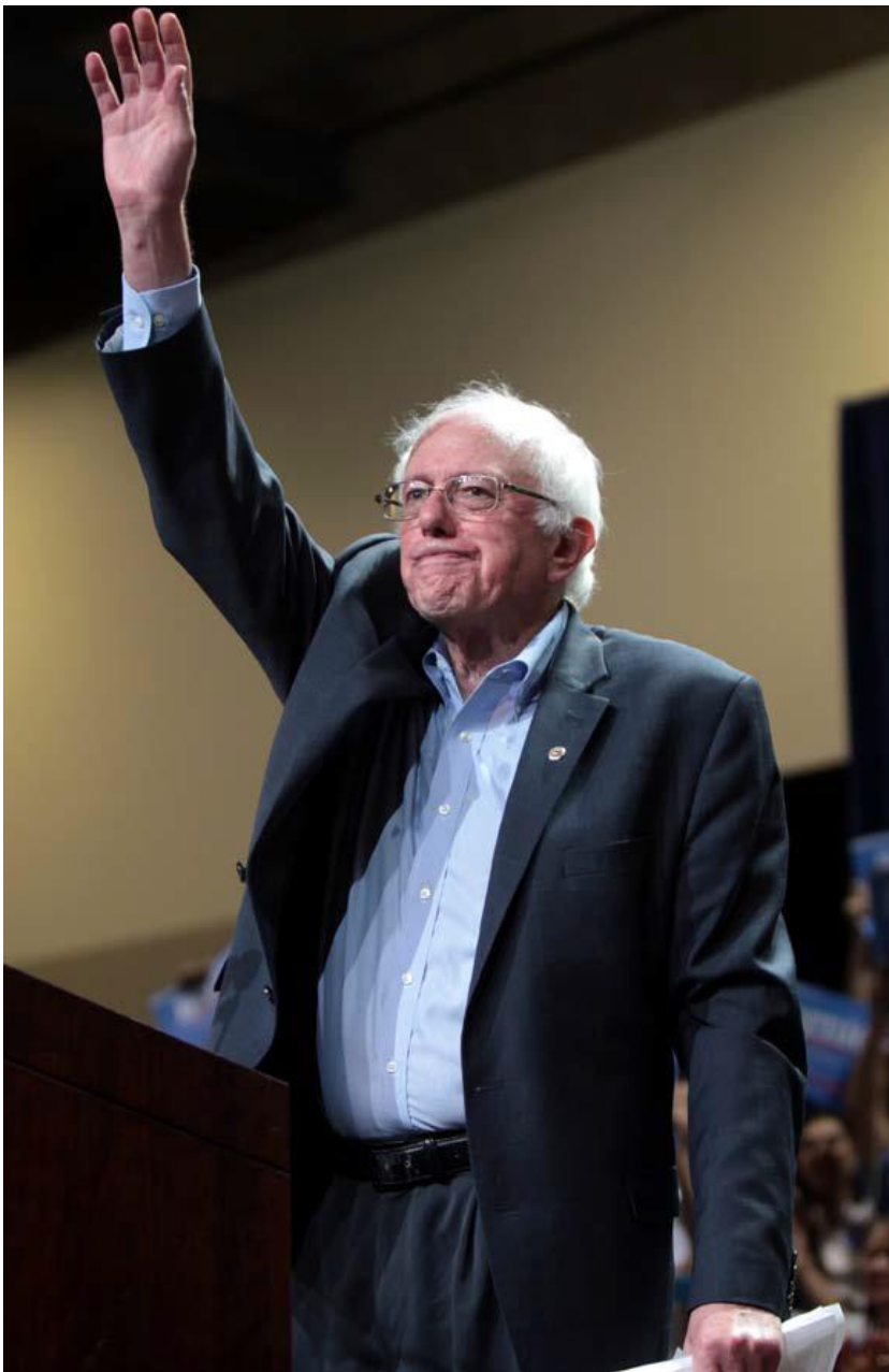
Bernie Sanders fantiserar om Demokraternas som folkets massparti

Men trumpismen – som nu har stärkts av statsapparaten och blivit alltmer ”normaliserad” – kommer förvisso att ge möjligheter för den nyfascistiska högern att mobilisera och bygga upp sig. Presidentskapets makt att utforma verkligheten ger diffusa, decentraliserade samhälleliga effekter, och utgör en lins via vilken folk ser och tolkar världen kring sig – och uppviglar till och oppmuntrar en dynamik och logik som verkar uppstå ”underifrån”. Och om han inte lyckas leverera så kommer hans regim sannolikt att gå åt höger, förvisso ett skrämmande framtidsperspektiv.