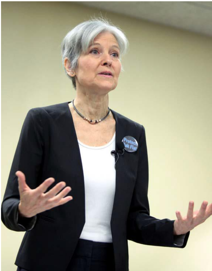
Jill Stein , ledare för det Gröna partiet