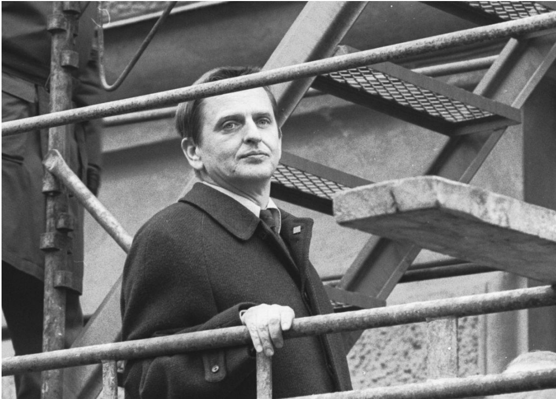
Olof Palme på 1 maj i början av 1970-talet.

Det var denna kombination av vänsterretorik och försvar av kapitalismen som gjorde att han i ena stunden kritiserade USA-imperialismen och i nästa stund blåljög om IB:s illegala övervakning av fackföreningsaktiva och fredsaktivister. Det var denna djupa inkonsekvens som gjorde Palme till en så effektiv försvarare av det svenska klassarbetet – "Saltsjöbadsandan" – och därmed oundvikligen även av det kapitalistiska systemet.