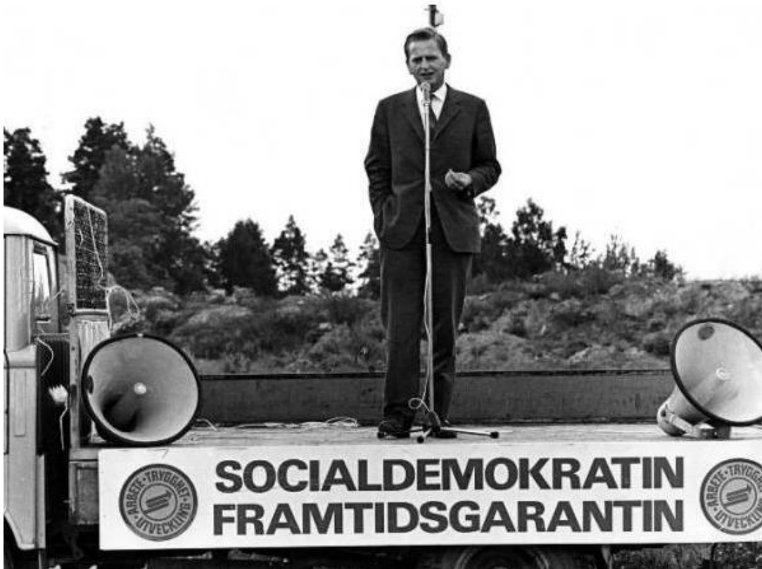
Olof Palme håller tal från ett lastbilsflak 1968.

Med sin militära bakgrund och förtrogenhet med överklassens sociala koder från sin tid på internatskola rörde sig Engström ledigt i Stockholms under 1980-talet öppna Palmehatande societets- och extremhögerkretsar – kretsar som inte sällan sammanföll med varandra. På de middagar Engström frekventerade deltog diplomater, överstar och företagsledare. Som fritidssysselsättning delade han gärna ut palmehatiska flygblad och bar knappor med niddbilder av Palme.