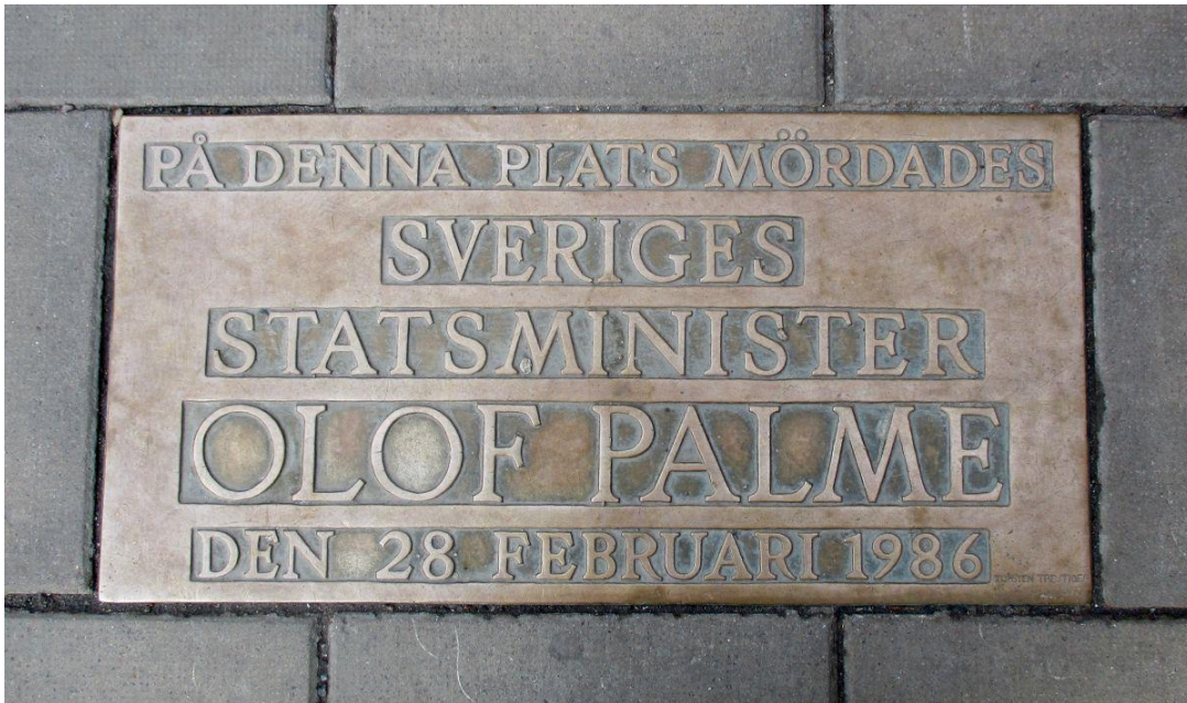
Minnesplakat på Sveavägen, på den plats där Olof Palme mördades.

och upplevde den där dramatiska och märkliga kvällen på och kring Sveavägen blev aldrig tagna på allvar och i vissa fall till och med negligerade och hotfullt bemötta".